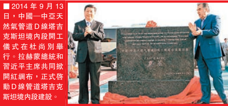
■2014年9月13日，中國—中亞天然氣管道D線塔吉克斯坦境內段開工儀式在杜尚別舉行。拉赫蒙總統和習近平主席共同掀開紅綢布，正式啓動D線管道塔吉克斯坦境內段建設。