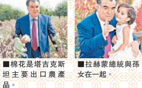
■拉赫蒙總統與孫坦主要出口農產品。