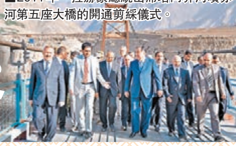
■2011年，拉赫蒙總統出席塔阿界河噴赤河第五座大橋的開通剪綵儀式。