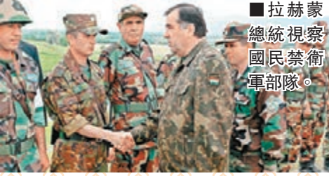
■拉赫蒙總統視察國民禁衛軍部隊。