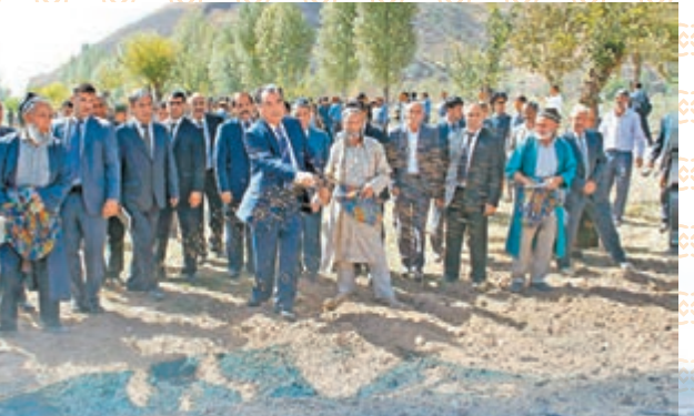
■拉赫蒙總統向田間播種。