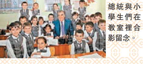
■拉赫蒙總統與小學生們在教室裡合影留念。