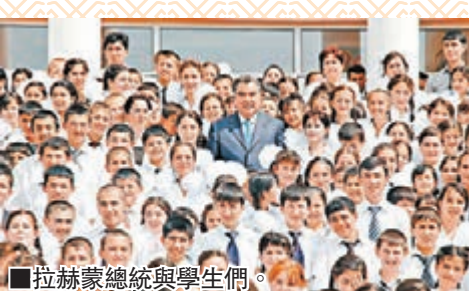
■拉赫蒙總統與學生們。