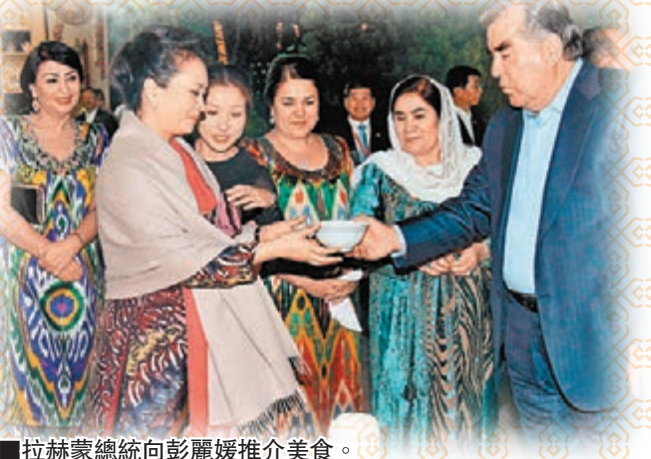
■拉赫蒙總統向彭麗媛推介美食。