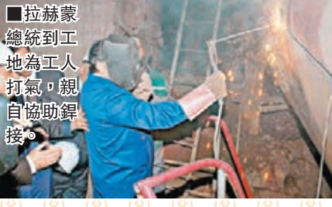
■拉赫蒙總統到工地為工人打氣，親自協助銲接。