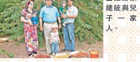
■拉赫蒙總統與兒子一家人。