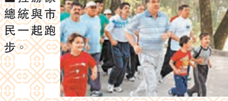
■拉赫蒙總統與市民一起跑步。