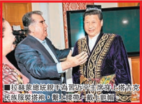
■拉赫蒙總統親手為習近平主席穿上塔吉克民族服裝塔袍，繫上腰帶，戴上氈帽。