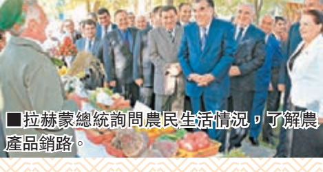
■拉赫蒙總統詢問農民生活情況，了解農產品銷路。