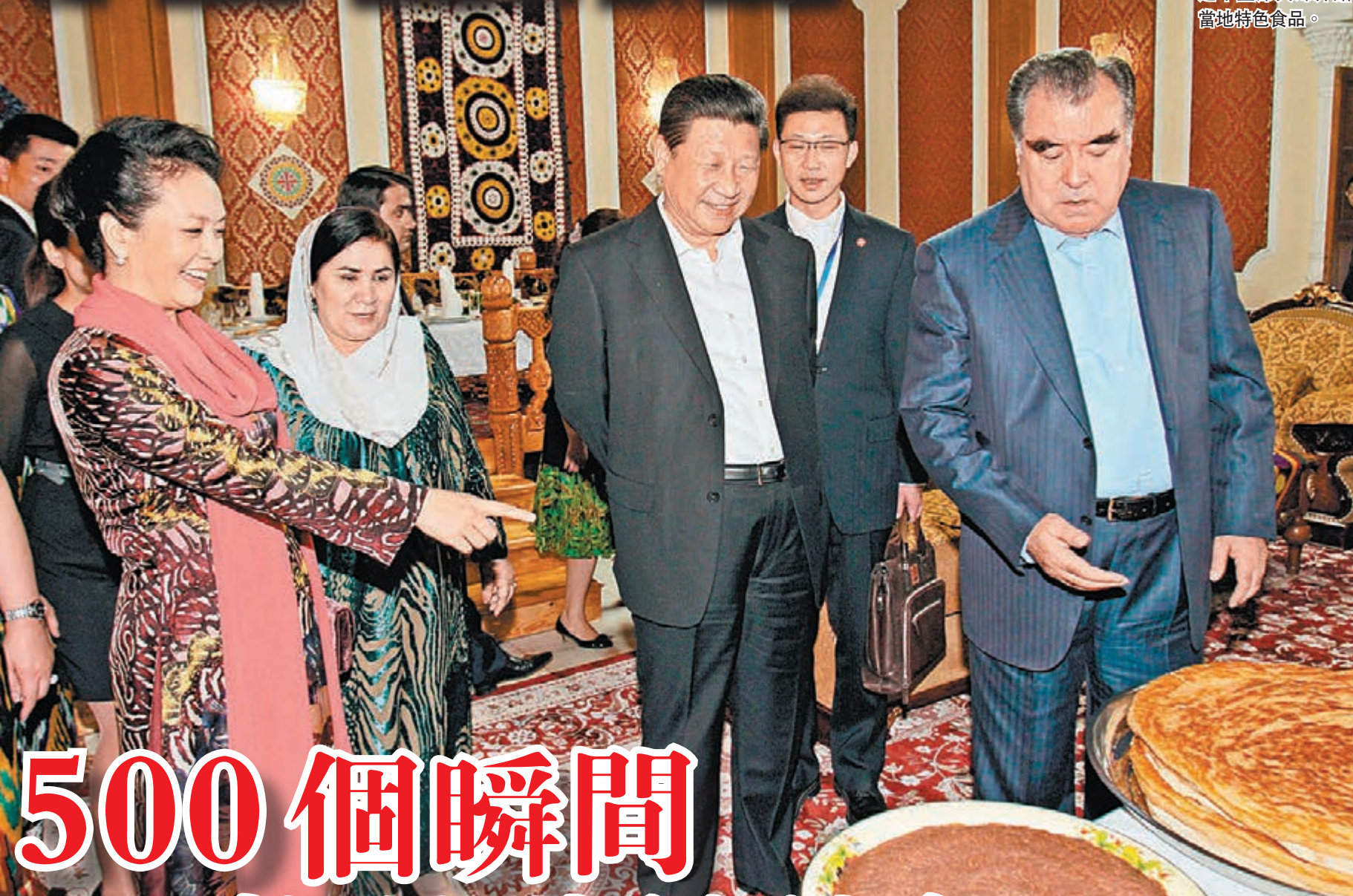
■拉赫蒙總統向習近平主席夫人介紹當地特色食品。