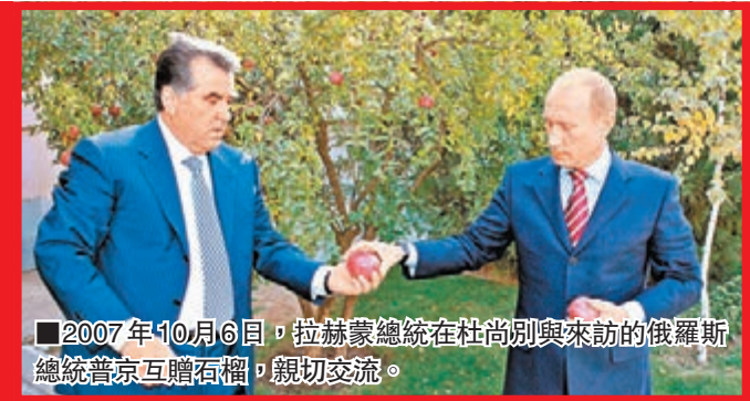
■2007年10月6日，拉赫蒙總統在杜尚別與來訪的俄羅斯總統普京互贈石榴，親切交流。