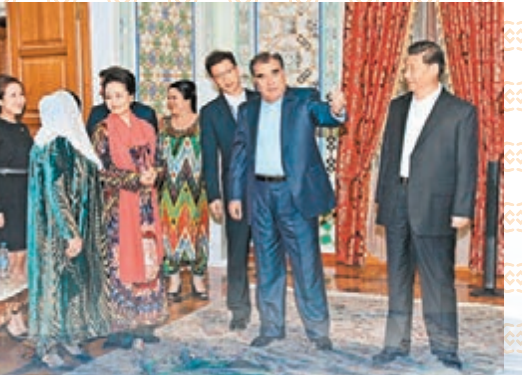
■2014年9月12日，拉赫蒙總統夫婦舉行家宴歡迎習近平主席和夫人彭麗媛。