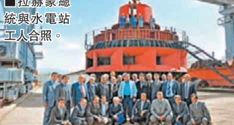
■拉赫蒙總統與水電站工人合照。