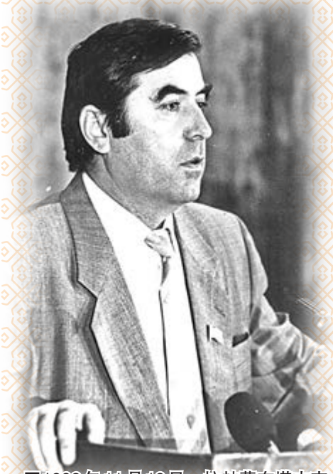
■1992年11月19日，拉赫蒙在塔吉克斯坦共和國最高蘇維埃第十六次會議上被選為最高蘇維埃主席(國家元首)後在會上發言。