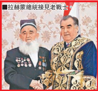
■拉赫蒙總統接見老戰士。