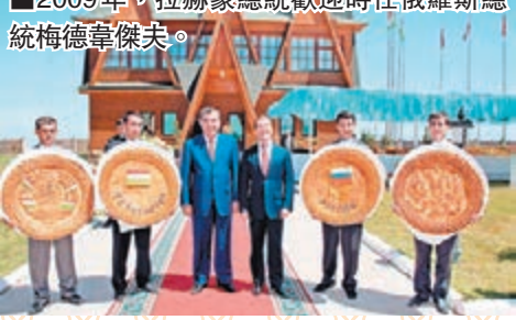
■2009年，拉赫蒙總統歡迎時任俄羅斯總統梅德韋傑夫。