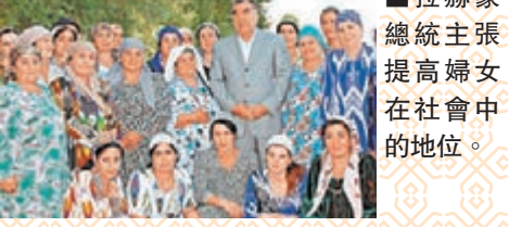
■拉赫蒙總統主張提高婦女在社會中的地位。