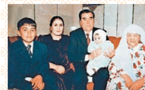
■拉赫蒙總統和家人。

位於中亞東南部的塔吉克斯坦共和國，素有「高山之國」的美稱，山上的冰川和積雪融化後，在帕米爾高原上形成了一條條奔流不息的河流。塔吉克斯坦有着璀璨的文化，充滿西域風情，一直與中國保持着傳統友誼。日前，《埃·拉赫蒙 締造傳奇》圖片集在香港出版並在北京舉行了首發式。這本收錄了500幅珍貴照片的圖片集，不僅展現了塔吉克斯坦共和國總統埃·拉赫蒙的政治生活風采，亦呈現了塔國秀麗的山川，記錄了中塔兩國間動人的友誼。