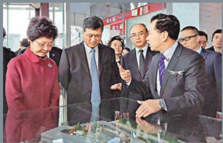
陳世昌向馬興瑞(左二)和林鄭月娥(左一)介紹港貨中心總體規劃和建設。