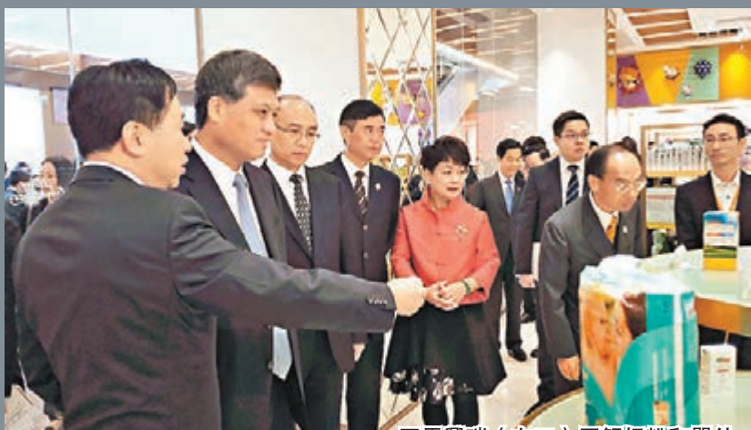
馬興瑞(左二)了解奶粉和嬰幼兒紙尿片的供應情況。