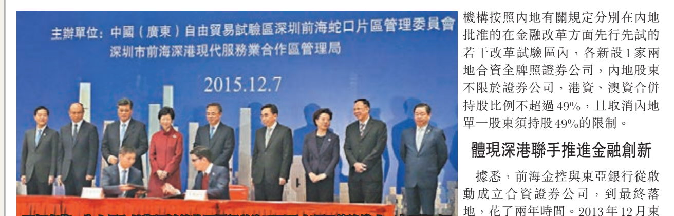
胡春華、朱小丹和林鄭月娥等共同見證前海系列重大項目簽約儀式。

在廣東省委書記胡春華、廣東省省長朱小丹和香港政務司司長林鄭月娥等共同見證的簽約儀式上，深圳市前海金融控股有限公司(以下稱「前海金控」)與東亞銀行有限公司(以下簡稱「東亞銀行」)達成協議，基於CEPA10框架，共同發起設立港資全牌照合資證券公司，其中東亞銀行持股49%。這是繼最近匯豐銀行與前海金控成立前海首家合資券商後，又一兩地合資券商落戶前海。