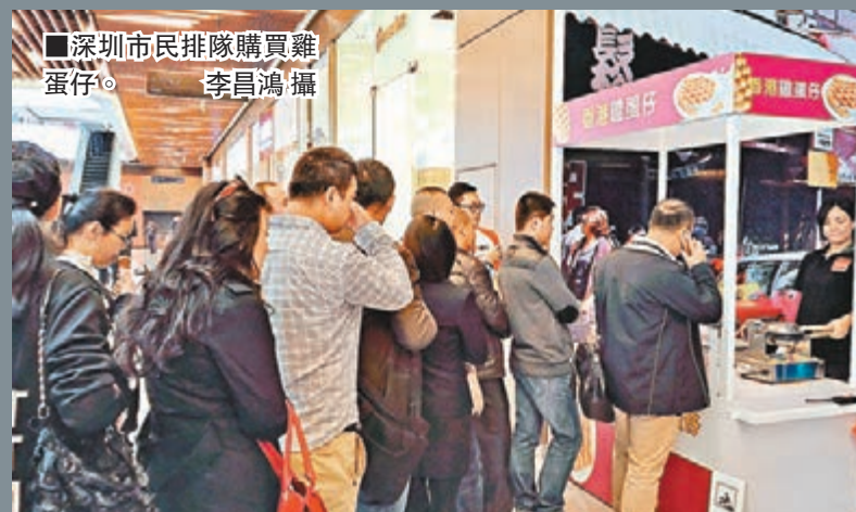
深圳市民排隊購買雞蛋仔。

昨日(7日)是習近平總書記考察深圳前海三周年紀念日。廣東自貿區深圳前海蛇口片區當天舉行重大系列項目簽約和啓動活動，其中備受香港和內地關注的前海周大福全球商品購物中心(俗稱港貨中心)一期正式開業。廣東省委常委、深圳市委書記馬興瑞、深圳市長許勤陪同香港特區政務司司長林鄭月娥一起視察了周大福全球商品購物中心，他們還與廣東省委書記胡春華、廣東省省長朱小丹等共同見證前海金融控股公司與東亞銀行簽訂合資證券公司和前海香港商會揭牌等重大項目簽約儀式。