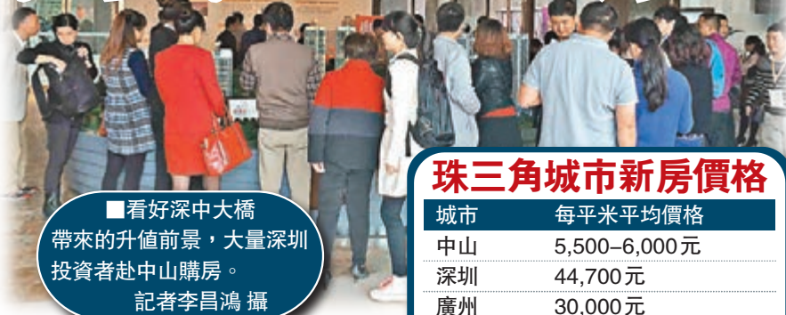
看好深中大橋帶來的升值前景，大量深圳投資者赴中山購房。

香港文匯報訊(記者 李昌鴻 深圳報導)因傳言深中大橋連接線開工的新聞發佈會將在本月15日舉行，大橋帶來的升值效應，加上中山房價低窪地效應，來自深圳和香港等地的購房者湧入中山。記者從地產代理獲悉，目前中山臨近深中大橋的多個樓盤已銷售一空，而每平方米均價也較三個月前的6,000元(人民幣，下同)上漲至目前的8,000元，短短幾個月漲幅超過30%。