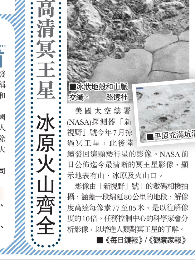
冰狀地殼和山脈交織。