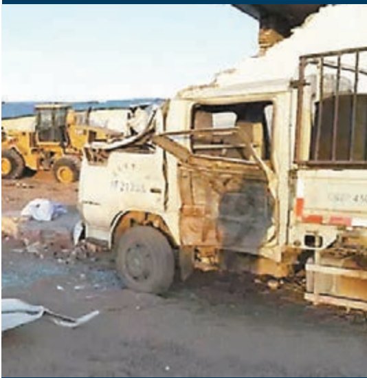
檢查站多輛執法車被暴徒推毀。本報內蒙古傳真