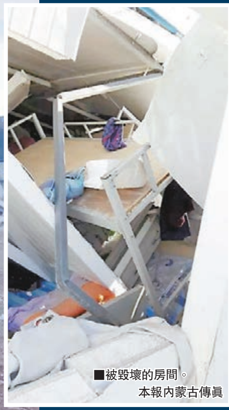
被毀壞的房間。