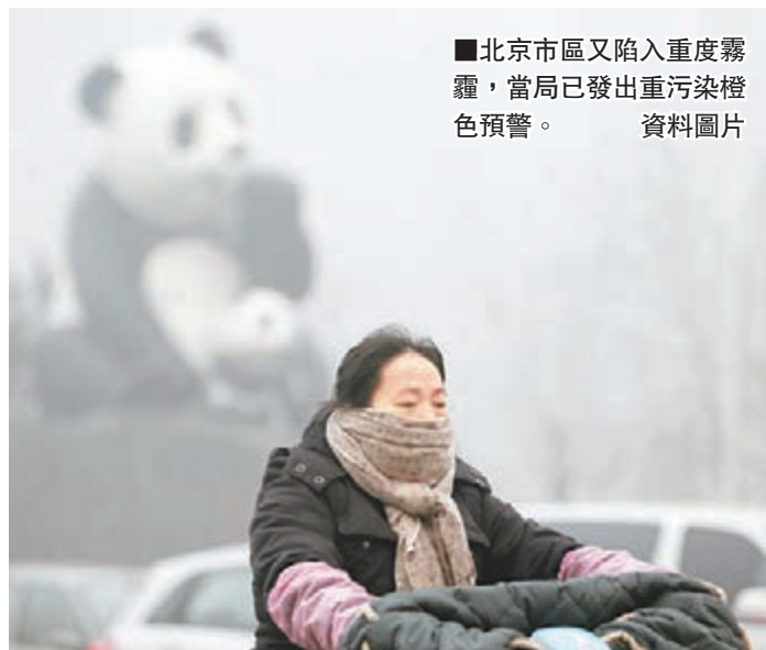
北京市區又陷入重度霧霾，當局已發出重污染橙色預警。資料圖片

在政府發佈預警的同時，普通民眾紛紛提前購買口罩、淨化器等裝備。更多的民眾開始反思在吐糟糟糕空氣之後還能做些什麼。有網友提出，「霧霾由污染造成，少用一度電、多乘公共交通工具少開車、不燃放煙花爆竹……對抗霧霾大家都應成為行動派。」