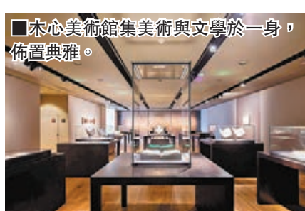
木心美術館集美術與文學於一身，佈置典雅。

到另一個盒子。」陳丹青介紹，木心美術館由三五現代幾何造型起伏銜接，高難度鑄造的清水混凝土外立面，以橫向的不規則表層和均勻的混凝土打道而成，館內各展室以五種微妙而深沉的暖灰色構成基調。中國美術館副館長張子康也評價道，遵照木心先生的遺願，秉承先生一直提倡的美學追求，木心美術館本色、簡約、寧靜，又飽含深情。