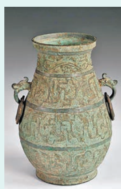
獸耳啣環銅壺