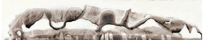
木心作品《晴風》紙本彩墨。

木心美術館的外觀，與木心心儀的簡約美學相契合。據悉，木心生前對自己的美術館，有明確的設計，「我的美術館應該是一個一個的盒子，人們可以聽著莫扎特音樂從一個盒子走