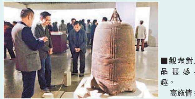
觀眾對展品甚感興趣。