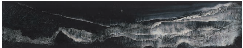
木心作品《戰爭前夜》紙本彩墨。