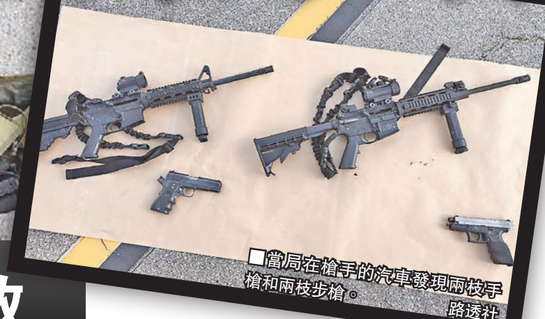
當局在槍手的汽車發現兩枝手槍和兩枝步槍。