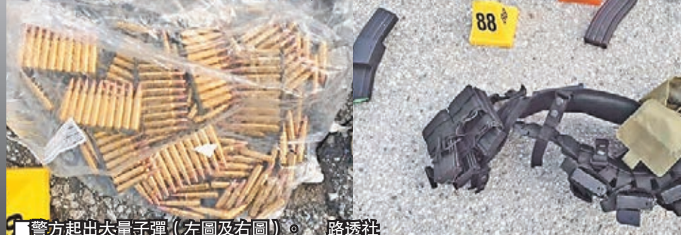
警方起出大量子彈(左圖及右圖)。