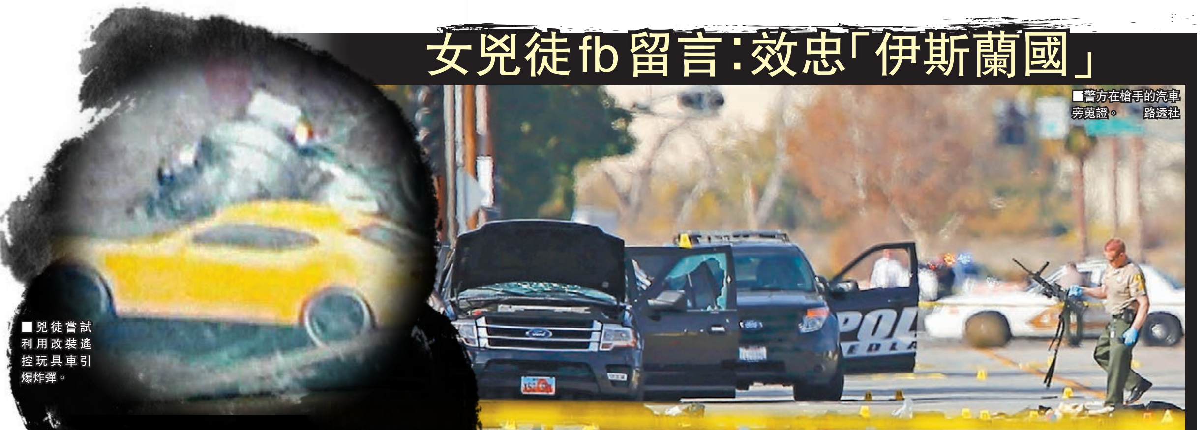
兇徒嘗試利用改装遙控玩具車引爆炸彈。