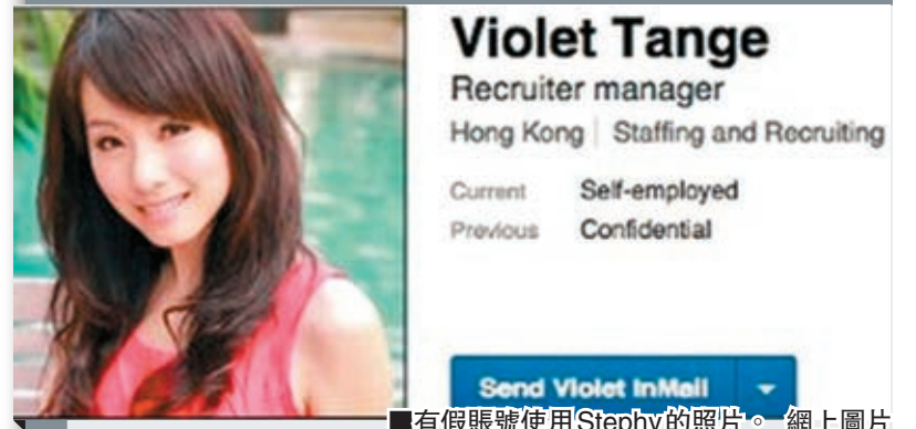
■有假賬號使用Stephy的照片。