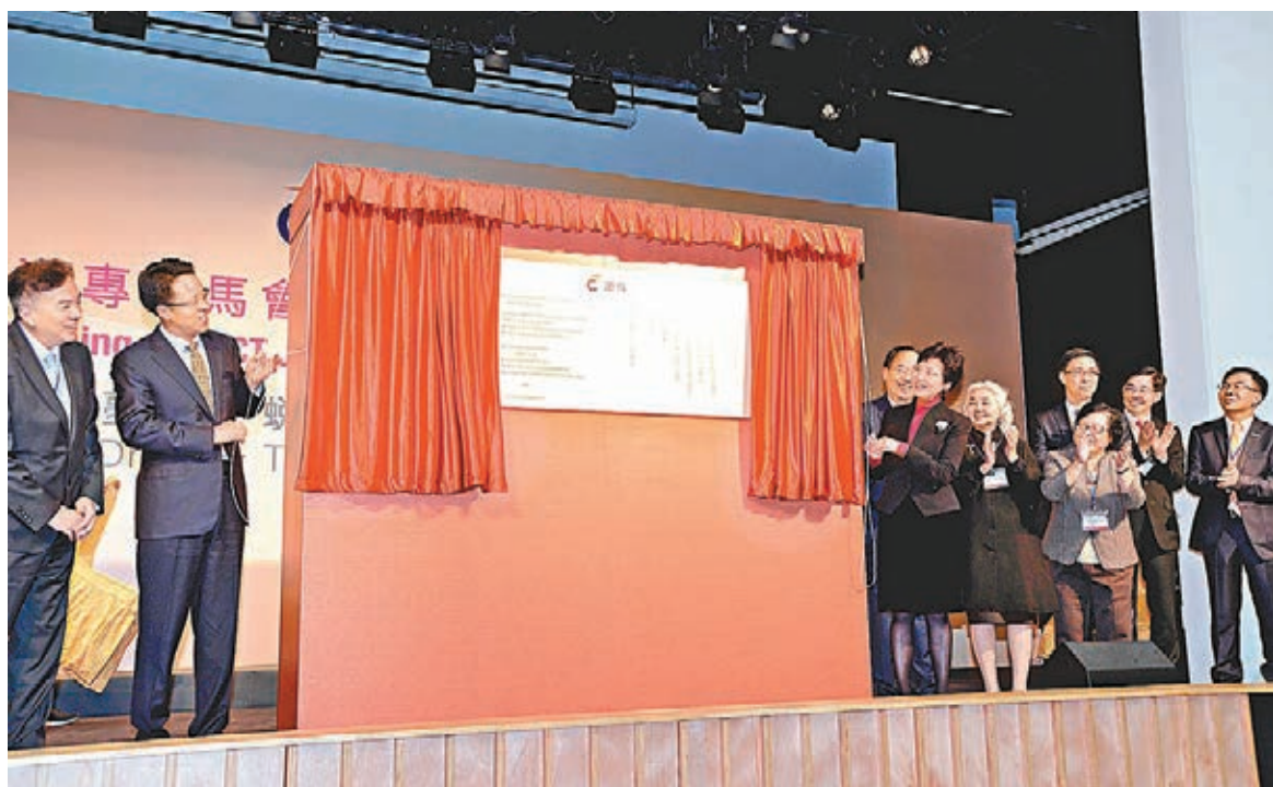
署理行政長官林鄭月娥、中聯辦主任張曉明與其他主禮嘉賓主持揭幕儀式。

香港文匯報訊(記者 鍾立)香港賽馬會慈善信託基金撥捐近4,500萬港元拓展的「港專賽馬會本科校園」昨日舉行開幕儀式,主禮嘉賓包括署理行政長官林鄭月娥、中聯辦主任張曉明等。林鄭月娥致辭表示,人才是香港發展的重要資本,但政府明白傳統學術教育未必適合所有青年人,故當局成立了推廣職業教育專責小組,並已於今年7月提交報告,建議重塑職業教育及培訓;加強推廣;持續工作三大策略共27項建議。政府正考慮專責小組的報告和建議,並會於適當時候對報告作出正式回應。