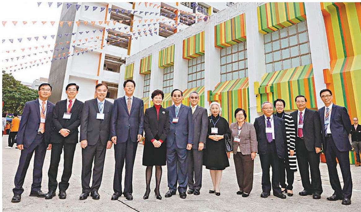
港專昨日舉行賽馬會本科校園開幕禮,邀請得一眾嘉賓出席。圖為嘉賓在校園合照,包括張曉明(左四)及林鄭月娥(左五)等。

在批地計劃下,政府已先後在2009年及2013年把兩所位於馬鞍山的校舍批予港專機構,作為港專及港專學院的校舍,並透過開辦課程貸款計劃,批出三筆約共7,000萬的貸款,支持港專早於紅磡教學中心的運作開支及翻新獲批的兩所馬鞍山校舍。