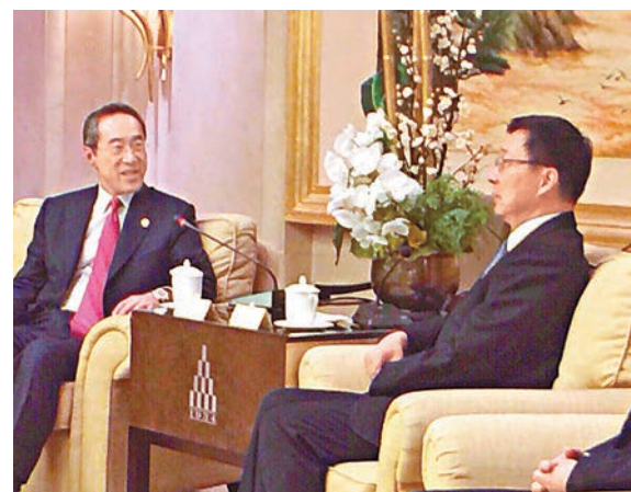
韓正(右)昨日會見了唐英年一行。

自貿區建設、城市交通、環境治理、政府審批制度改革等情況。 上海市海外聯誼會副會長唐英年說,長期以來,海聯會各位成員與國家改革開放、與上海經濟社會發展有着密不可分的聯繫,很多成員的「第二代」甚至「第三代」都接力參與進來。大家對上海有深厚感情,對上海未來發展充滿信心。希望在國家全面深化改革、進一步擴大開放的進程中作出更大貢獻。 上海市委常委、統戰部部長、上海市海外聯誼會會長沙海林參加會見。