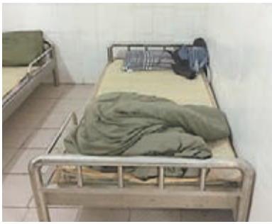
■黃某的床位。