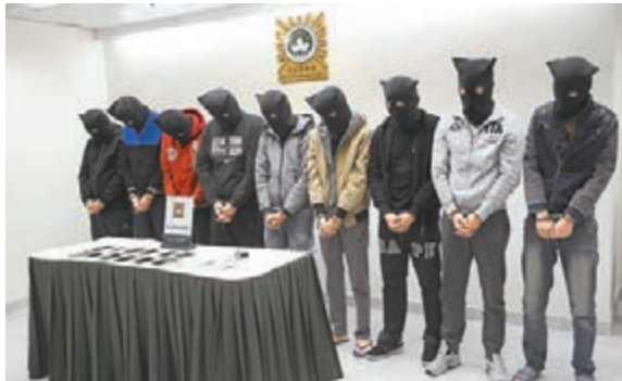
■涉嫌組織詐騙集團進行詐騙被捕9名澳門青年，是中學同學及朋友關係。

友關係。司警表示，9人作案後瓜分金錢，有人稱金錢已經用作賭博和消費。現時相信集團至少涉5宗案件，在去年上半年也接過類似案件，不排除集團涉更多案件，會對案件作進一步調查。