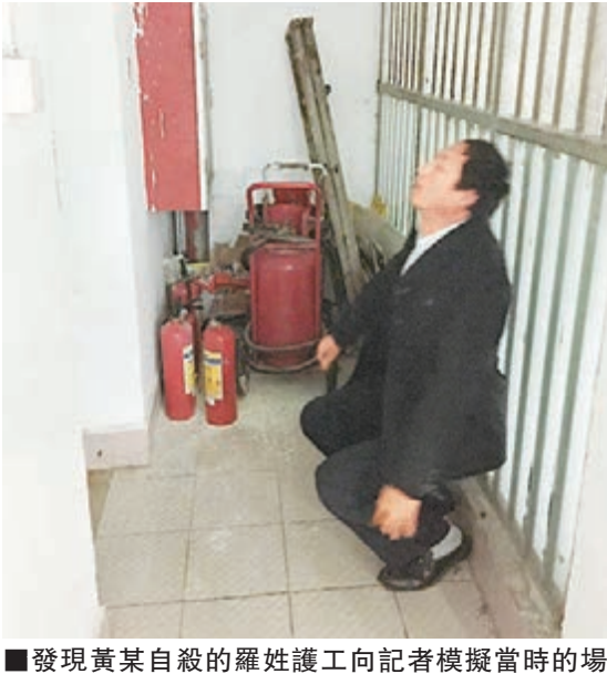
■發現黃某自殺的羅姓護工向記者模擬當時的場景。