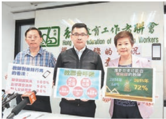
■教聯會調查發現，有21%受訪教師指，曾有人偷錄教師在校的言行並上載互聯網。

她認為，偷錄是否適當，要視乎偷錄者的動機，倘動機是為了惡作劇，當然要遏止；若是出於對別人的投訴，雙方理應當面商討；若旨在舉報不當行為，如早前有特殊學校教師向學童當面噴灑消毒火酒，偷錄行為就值得商榷。