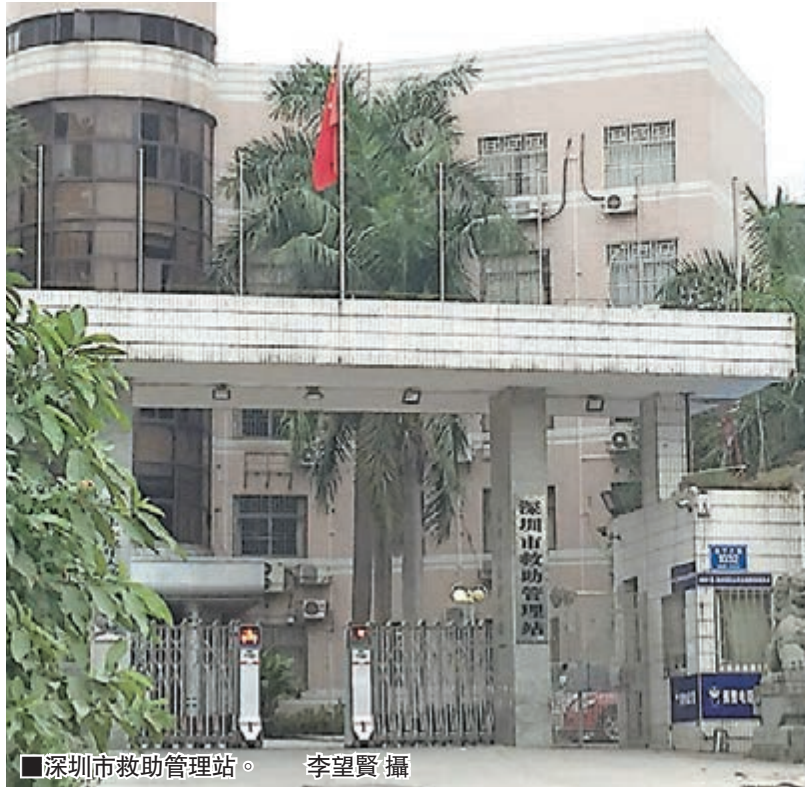
■深圳市救助管理站。