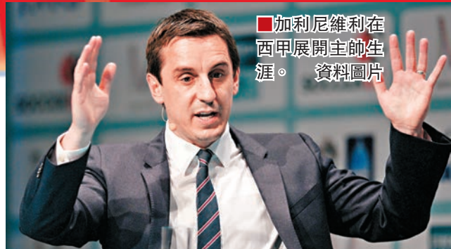
加利尼維利在西班牙甲組聯賽執教的資料圖片。