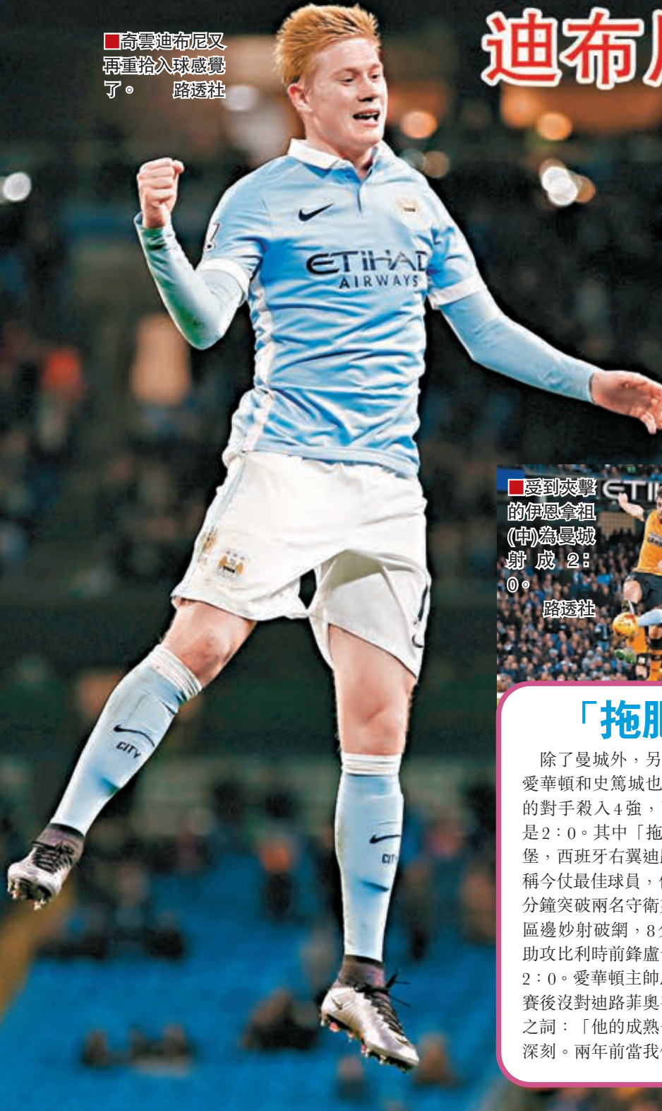
奇雲迪布尼又再重拾入球感覺了。