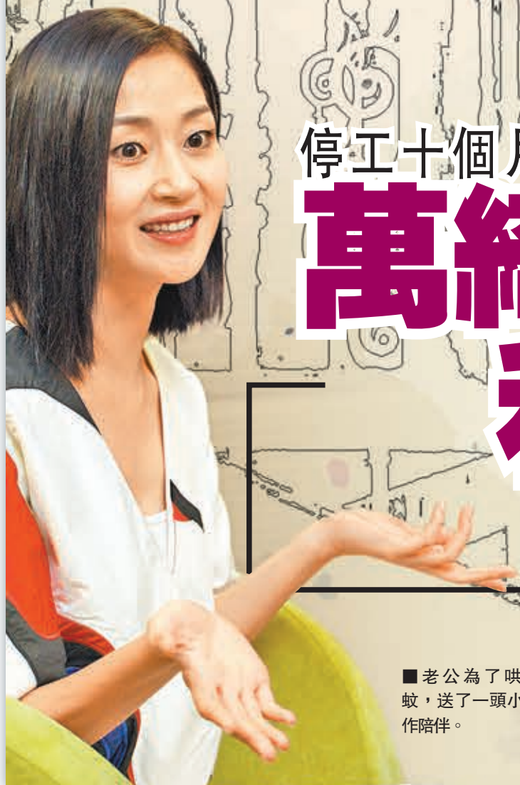
■老公為了哄蚊蚊，送了一頭小狗作陪伴。