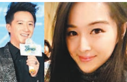
■韓庚(小圖)和國外女友李冰玉愛得甜蜜。