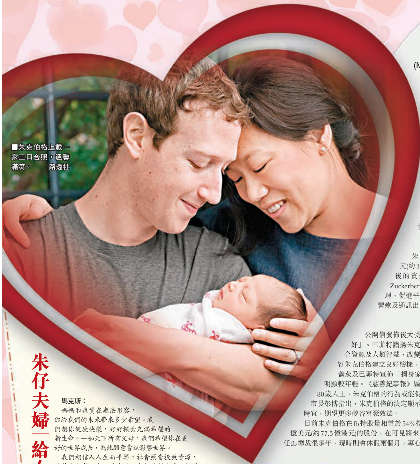
朱克伯格上載一家三口合照，溫馨滿瀾。

社交網站 facebook(fb)創辦人朱克伯格終為人父！他昨日通過 fb 表示，華裔妻子普麗西拉·陳(Priscilla Chan, 譯音)上周順利誕下重7磅8安士的B女，取名「馬克西瑪」