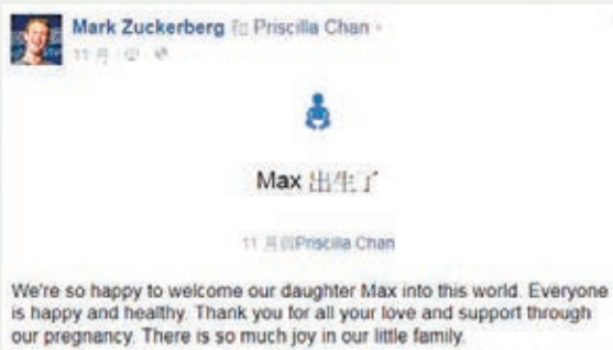
朱仔個人專頁新增女兒出世的大事。

(Maxima)，小名「馬克斯」(Max)，又上載一家3口的合照。適逢弄瓦之喜，朱克伯格宣佈將於有生之年，逐步捐出夫婦所持 fb 股份的99%作慈善用途，成為繼微軟創辦人蓋茨及「股神」巴菲特等人後，另一名承諾捐出近全部身家的超級富豪。