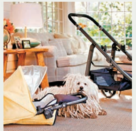
夫婦二人上月已準備嬰兒車。