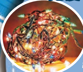
聖誕燈飾(圖)會拖慢WiFi?

英國通訊監察機構Ofcom指出，聖誕燈飾與嬰兒監測器及微波爐一樣，會發出無線電波，干擾WiFi訊號，拖慢網速。