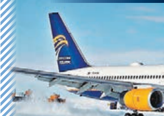
民航客機成功在南極冰面著陸。

南極洲不少地區常年被冰雪覆蓋，難以興建機場跑道，不過一架波音757客機上周四成功在聯合冰川的「藍冰」冰面著陸，是首次有民航客機在南極降落，未來前往南極旅遊或會變得更容易。