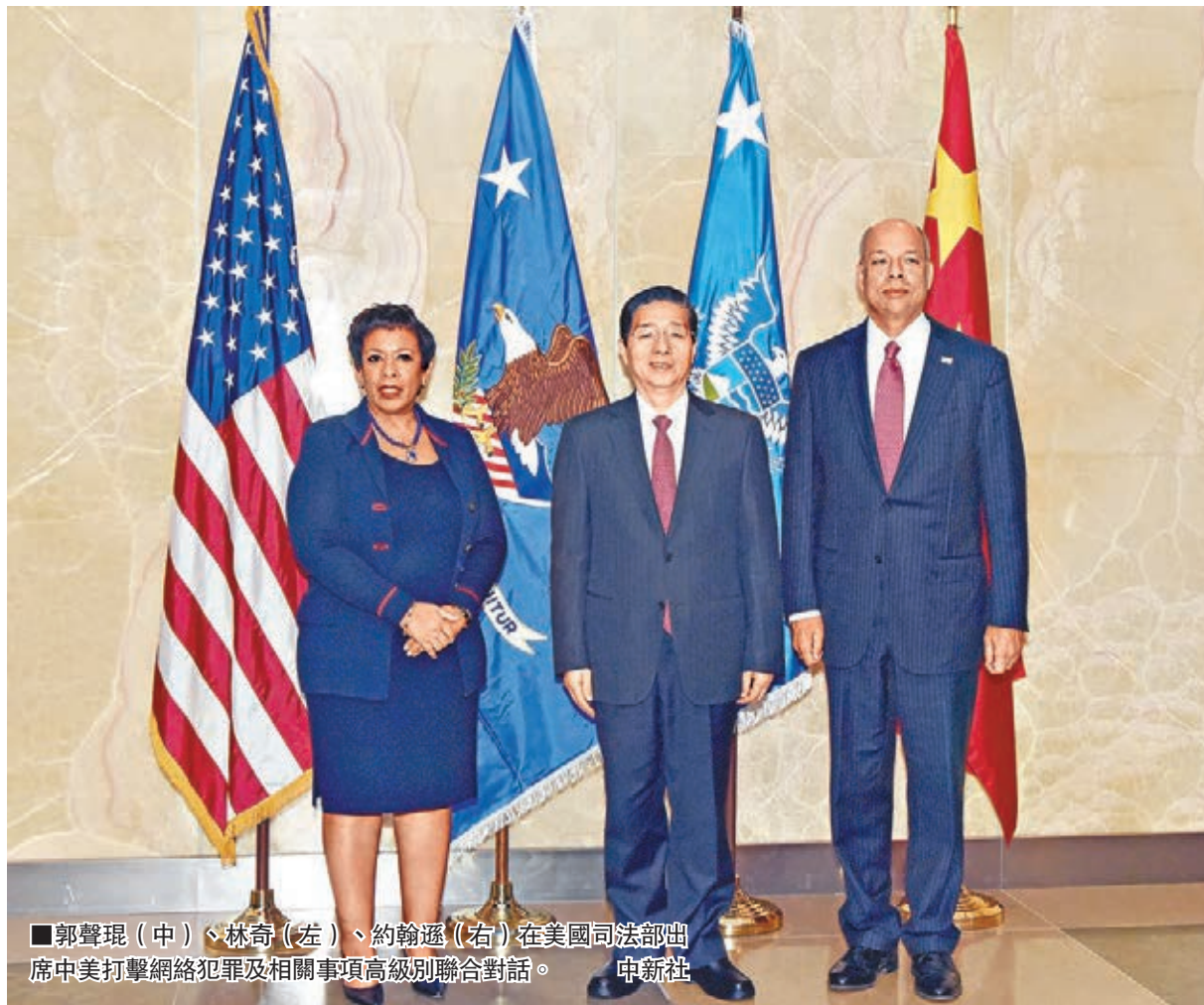
郭聲琨(中)、林奇(左)、約翰遜(右)在美國司法部出席中美打擊網絡犯罪及相關事項高級別聯合對話。

郭聲琨指出，當前，中美網絡安全執法合作進入新的發展階段，雙方通過務實合作和坦誠交流，解決一些實際問題，增進了雙方了解和互信。中方願本着「依法、對等、坦誠、務實」的原則，與美方一道，推動構建合作共贏的中美網絡安全執法合作機制。雙方應堅持把對話機制作為中美就網絡安全問題開展交流溝通的主渠道，及時、有效回應彼此關切，建設性管控分歧。希望