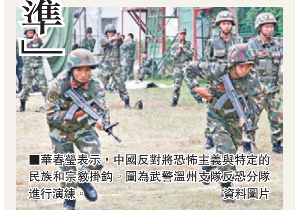
華春瑩表示，中國反對將恐怖主義與特定的民族和宗教掛鉤。圖為武警溫州支隊反恐分隊進行演練。

華春瑩說，恐怖主義沒有好壞之分。恐怖主義是全人類的共同敵人，這已經是國際社會公認的事實。對於恐怖主義給人們帶來的嚴重危害，大家都應該是有切膚之痛的。加強團結協調、合力反恐是目前國際社會的高度共識和面臨的共同挑戰。個人、個別媒體散佈有關謬論，絲毫無助於國際反恐努力。「我們希望有關媒體人士尊重事實，遵守新聞職業道德，認真反思自己的所作所為，不要繼續讓偏見蒙蔽了自己的雙眼。」