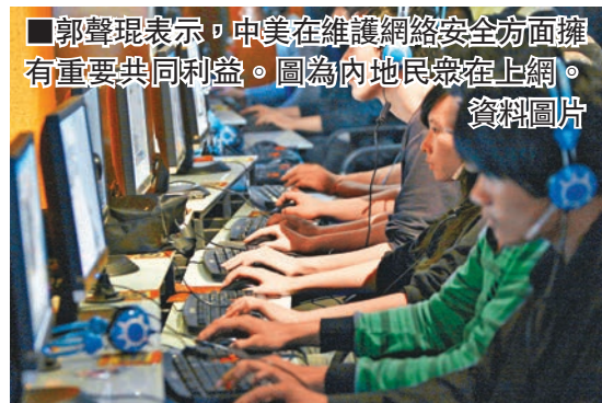
郭聲琨表示，中美在維護網絡安全方面擁有重要共同利益。圖為內地民眾在上網。

中央政法委和公安部、網信辦、外交部、安全部、工信部和司法部等部門負責人出席了對話。