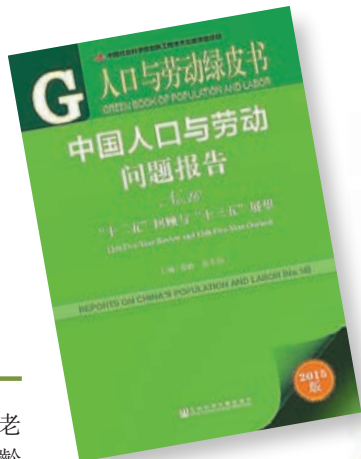
中國社科院綠皮書。

香港文匯報訊(記者 王珏 北京報道)中國社會科學院昨日發佈的《人口與勞動綠皮書》建議，內地延遲退休可分「兩步走」：2017年完成養老金制度併軌，從2018年開始，女性退休年齡每3年延遲1歲，男性退休年齡每6年延遲1歲，至2045年男性、女性退休年齡同步達到65歲。