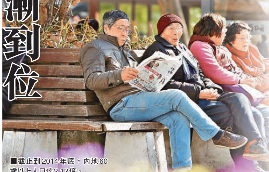
截止2014年底，內地60歲以上人口達2.12億。

但也有相當部分網友認為，若實行「一刀切」延遲退休政策，則太過剛性，會侵犯部分群體利益，更不能從根本上解決老齡化問題。網友「喂豬得樂」說，延遲退休，有權有福利的官員們高興了，他們本來就不願意離開「金飯碗」，但一直幹苦力活的普通職工苦了，60多歲還能幹得動嗎？另一位大學生網友「沫沫花開」則擔心，現在應屆畢業生人數逐年增加，找工作已經很難，延遲退休後將有更多崗位騰不出來，「以後求職更要擠破頭了」。不少網友表示，中國養老保險體系還沒有成熟，若在退休年齡上跟國際靠得很近，並不現實，期待官方制定政策時更審慎嚴謹。