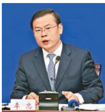
人社部新聞發言人李忠。

在立足中國國情，深入分析經濟社會發展趨勢，借鑒國際經驗基礎上，為推動建立更加公平、可持續的社會保障制度，2013年的中共十八屆三中全會決定提出研究制定漸進式延遲退休年齡政策，今年舉行的十八屆五中全會進一步提出出台漸進式延遲退休年齡政策。