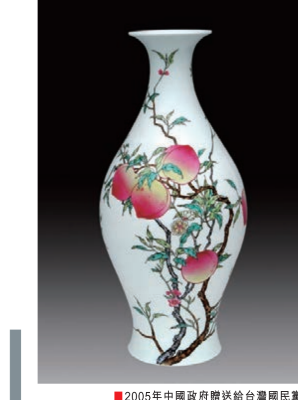
■2005年中國政府贈送給台灣國民黨主席連戰的禮品瓷：仿清雍正粉彩蝠桃紋敞口瓶。

裂單位。目前，佳洋依靠200位左右的員工，每年創造了600萬元的稅收。下一步，伴隨「一帶一路」戰略的推進，佳洋勢必迎來更好的發展局面。 作爲世人眼中的「黃窯」，黃雲鵬先後創辦了皇室牌高仿瓷與皇室景區。「『皇室』諧音『黃窯』，又取景德鎮話的聚眾之意。」據他介紹，皇室景區占地210畝，地處景德鎮五代、宋、元窯址群之中，按國家5A級景區標準傾力打造，堪稱景德鎮景區《陶陶園》的再現版，瓷都千年制瓷工藝的濃縮版，皇室陶瓷文化產業化的創新版。 「爲了建皇室景區，我已投入1.2億元，貸款5,000萬元。我本來可以將1.2億元來理財，但是到了我這把年紀，傳承中國傳統文化是最好的使命。」在讀萬卷書，行萬里路、究瓷道的過程中，黃雲鵬愈來愈意識到瓷器作爲傳統文化載體的重要性。他在六十年代中期文物沒有太多重視爲免遭受損害，將大批流落在民間和有關單