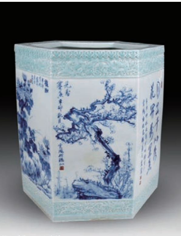
■黃雲鵬作品：六方鎮罐。

「青花是單色色相，色階濃淡層次豐富，表現力非常強；其基色是雅，如果運用恰當，是什麼都可以表現出來。元青花是中國青花陶瓷藝術