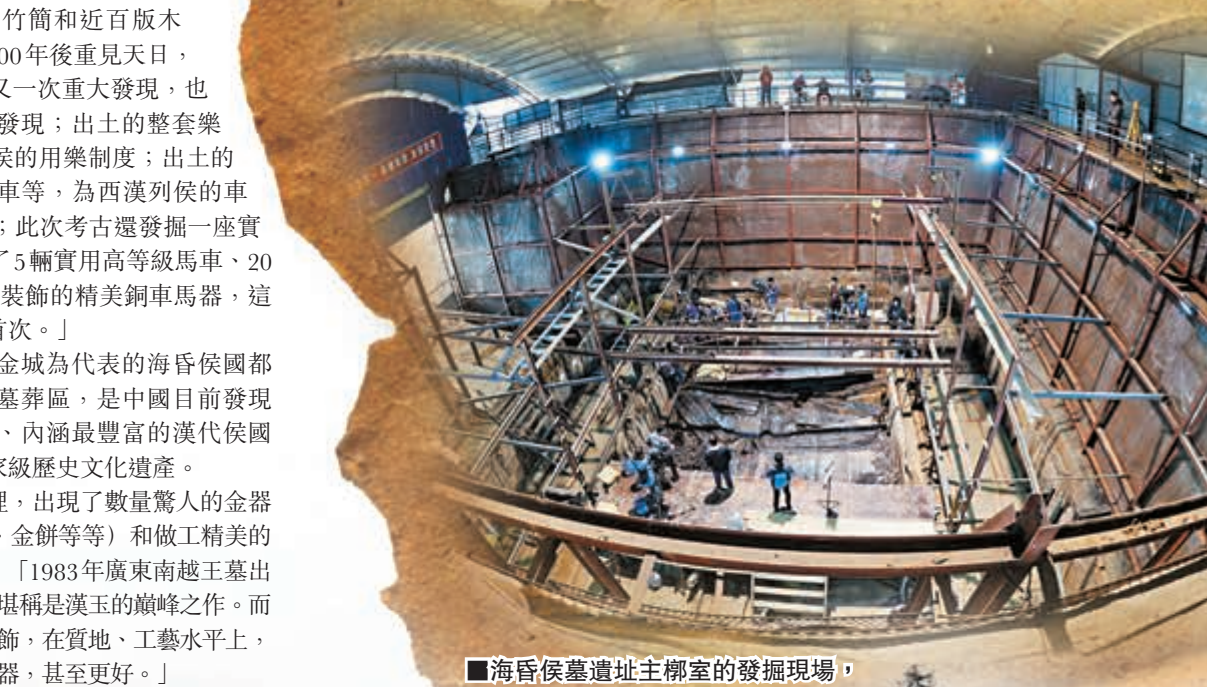
■海昏侯墓遺址主柩室的發掘現場，整個墓園佔地面積約4萬平方米，已清理出土文物1萬餘件。 資料圖片