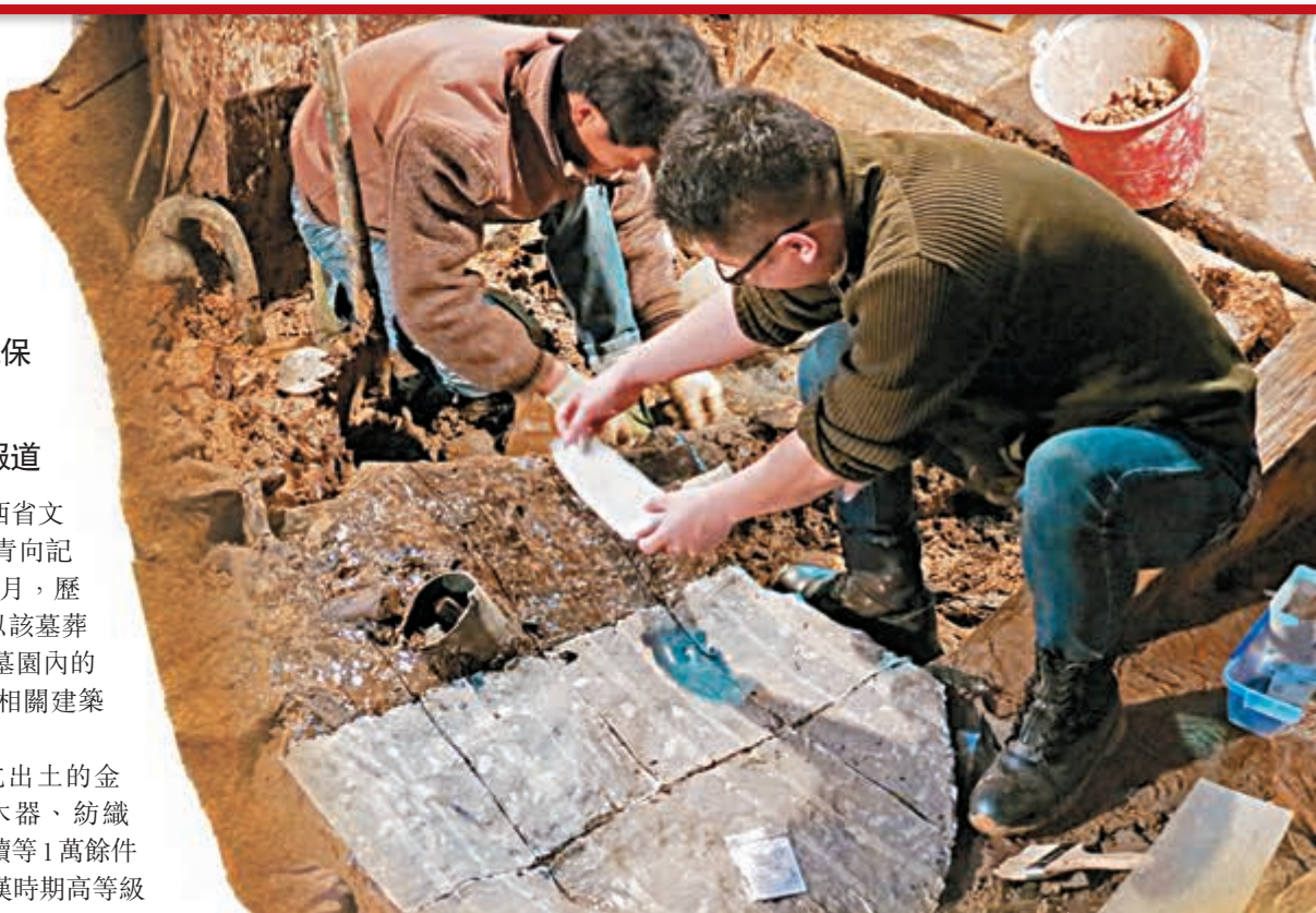
■考古工作人員現場提取古墓遺蹟。 本報江西傳真

在近日挖掘的主柩室裡，出現了數量驚人的金器堆（包括數10枚馬蹄金、金餅等等）和做工精美的龍鳳紋玉珮。徐長青說：「1983年廣東南越王墓出土了一批漢初精美玉器，堪稱是漢玉的巔峰之作。而海昏侯墓出土的這件玉珮飾，在質地、工藝水平上，都堪比南越王墓出土的玉器，甚至更好。」