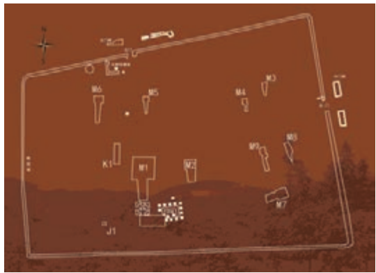
■海昏侯墓園結構圖。 本報江西傳真

「迄今已出土的1萬餘件文物，特別是海昏侯墓及其車馬坑出土的9千餘件文物，形象再現西漢時期高等級貴族的生活，具有極高的歷史價值、藝術價值和科學價值。」專家稱，其考古價值超過湖南長沙馬王堆漢墓。