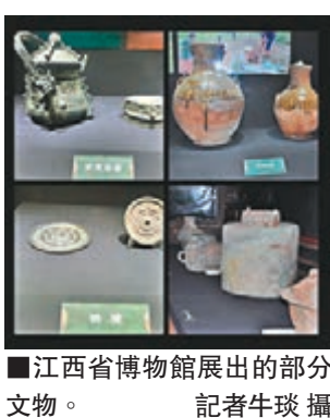
■江西省博物館展出的部分文物。

「盥(yì第二聲，音同「儀」)是古代漢族的一種盥洗器。《左傳》有「奉盥沃盥」的話，沃的意思是澆水，盥的意思是洗手洗臉，說明盥是古代盥洗時澆水的用具，是中國古代漢族貴族舉行禮儀活動時澆水的用具。早期