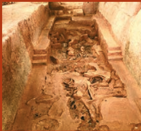
■位於主墓西側的車馬陪葬坑，是長江以南首次發現的大型車馬陪葬坑。

在海昏侯的主墓室藏閣發掘中，迄今已出土金器、青銅器、鐵器、玉器、漆木器、陶瓷器、紡織品和竹簡、木牘等各類珍貴文物6,000餘件；加上車馬坑和其他附葬墓出土的文物，文物總數已經超過1萬件。對此，徐長青表示，「目前，文物提取工作正在進行中，相信會有新的驚喜和收穫。」