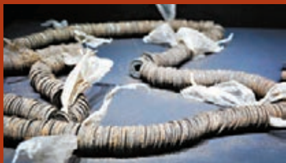
■五銖錢的發現首次證明唐宋以來以1,000文銅錢為一貫的枚量方式最遲起源於西漢。