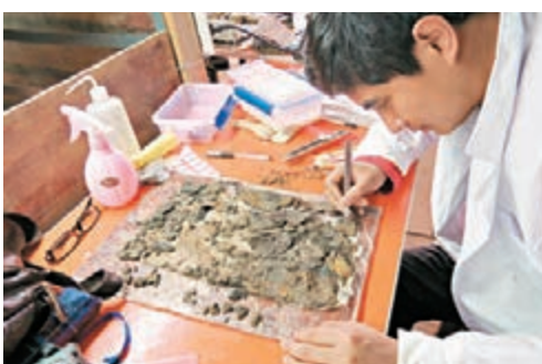
■工作人員正在室內修復文物。

記者從南昌西漢海昏侯墓考古發掘現場獲悉，由於文物保護難度大，考古發掘中運用了低壓氧倉文物保護設備等大量高新技術，這在世界考古史上屬首次。