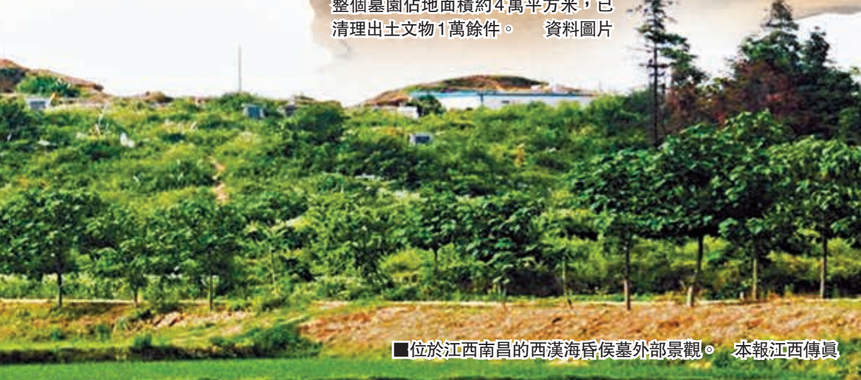
■位於江西南昌的西漢海昏侯墓外部景觀。