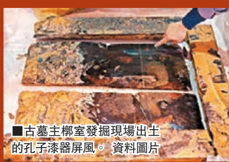
■古墓主柩室發掘現場出土的孔子漆器屏風。 資料圖片