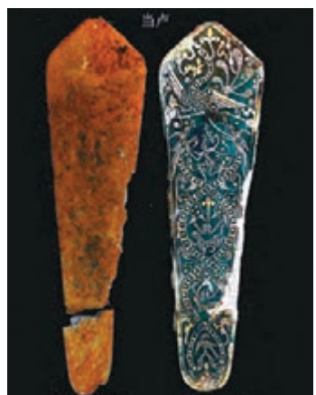
■古代繫於馬頭部的飾件當虛修復前後對比。