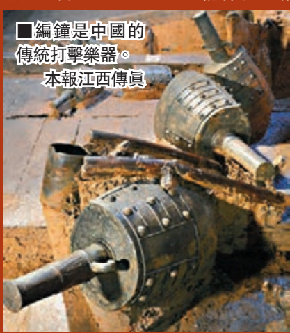
■編鐘是中國的傳統打擊樂器。 本報江西傳真