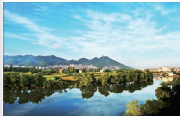
■冰溪晨曦，江南夢裡水鄉，宛若畫卷。

商務中心」、「體育休閒文化小區」等硬件設施，以及星牌品牌、賽事資源、球星經紀等軟件投入，將形成由檯球賽事、文化創意、教育培訓、產品研發、歷史博覽組成的文化產業綜合體。