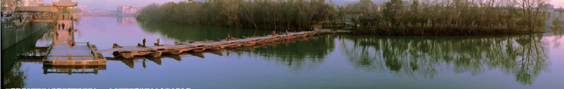
■萬柳洲公園是玉山旅遊最靚麗的風景之一，充分展現了當地歷史文化和自然生態。