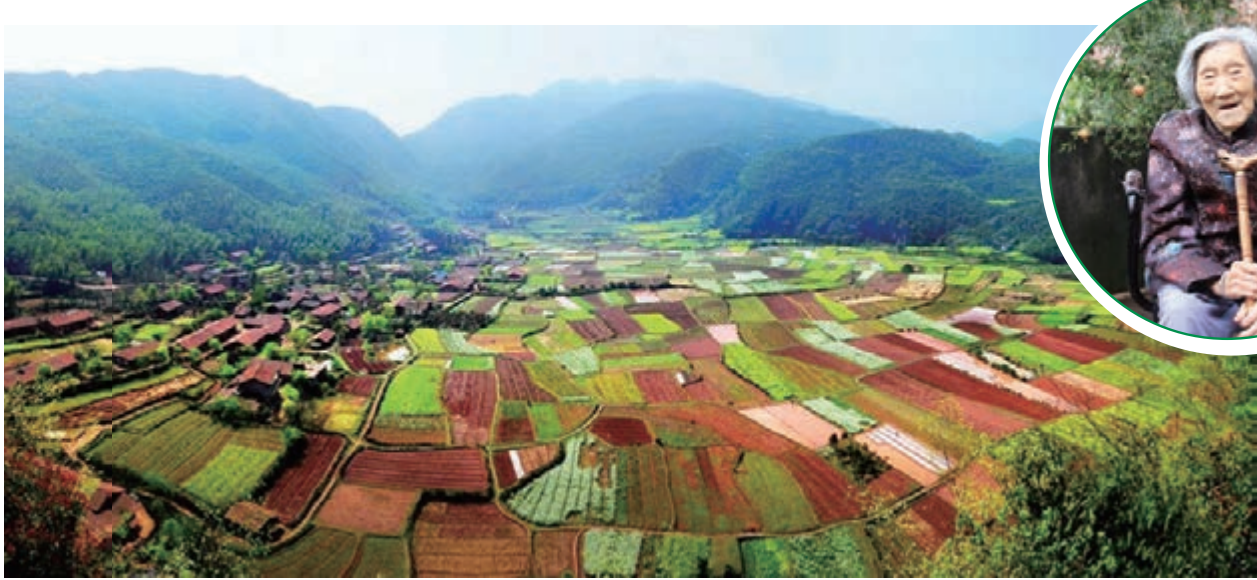
■陶源瀨底自然村至今保留着原始的房屋建築與人文生活，被譽為「最後的香格里拉」。

鄭曉春書記說：「科學發展到今天，工業發展與環境保護之間的矛盾對立性減少了一些。對於環保不達標的工業企業，玉山縣堅決拒絕引進。對於原有環保不達標的企業，要麼企業自身轉型直至達標，要麼政府回購土地。」