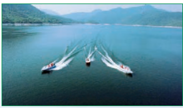
■置身三清湖，即可攬清風明月又可烹魚煮蝦，羽化而登仙。園、冰溪古城，形成了近10公里首尾相接、遙相呼應的濱河「十里畫廊」。

早晨和傍晚，市民沿着冰溪河步行鍛煉，映入眼簾的是一片波光粼粼的水面，野鳥飛翔，十裡楊柳，迎風搖曳。經過多年的潛心治城、精心治水，幾年前荒草叢生、垃圾遍地的冰溪河荒岸，如今已是一個佔地130畝的萬柳洲公園；昔日黃土裸露的城區北坡，如今搖身變成了風光旖旎的懷玉公園；縣城沿河上起南門公園，下至文成塔民俗文公，中間鑲嵌沿河文化公園、萬柳洲公