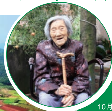
■玉山102歲老壽星喜歡吃當地所產的瓜果蔬菜，她把自己長壽的原因歸功於優越的生態環境。

「縣級城市能舉辦世界級賽事，對我們城市的形象提升非常有利，讓我們玉山人很驕傲。我們出去可以介紹自己來自『中國玉山』！」不少玉山百姓告訴記者，地處一隅的玉山縣越來越具有國際範。