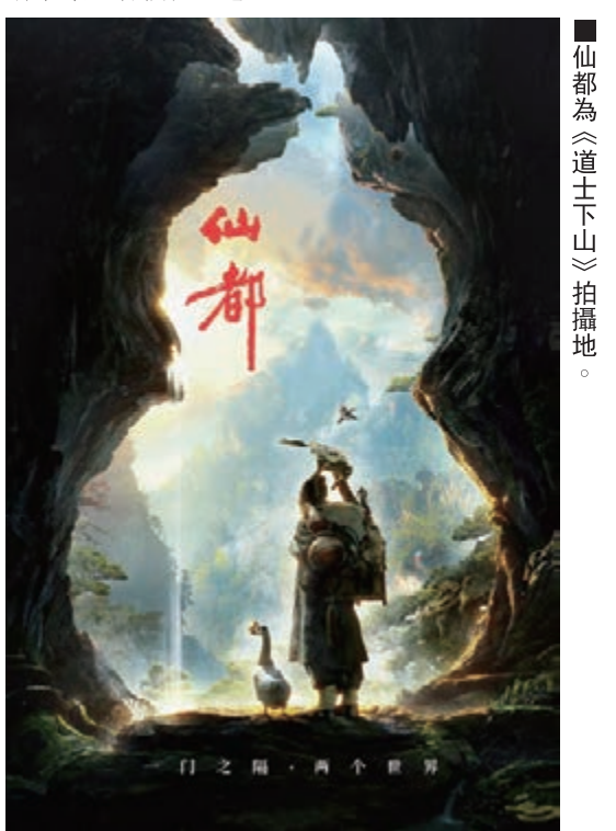
仙都為《道士下山》拍攝地。

仙都是愛情的神聖之地，以其美好的愛情寓意、獨特的神秀山水、深厚的人文底蘊，成為婚紗攝影的首選景點，每年有成千上萬新人在仙都拍攝婚紗照。仙都也是愛情體驗之地，經常舉辦與浪漫主題相關的節慶活動，讓青年男女徜徉於神秀山水間喜獲良緣。仙都一池碧波春水、滿徑綉爛桃花的浪漫場景讓遊客們流連忘返。