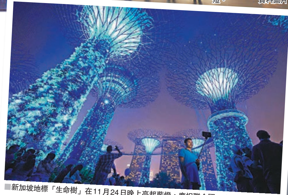
新加坡地標「生命樹」在11月24日晚上亮起藍燈，慶祝聯合國70周年。

基於以上考慮，近日英法提出限制安理會否決權的動議，恐怕是難以通過。因為在國際上出現的衝突，如區域戰爭和內戰衝突等問題，背後往往代表大國的外交、經濟利益，假若放棄運用否決權，則各國會擔心對方借助聯合國此一組織損害己方利益，處理不好，甚至會導致個別大國因不滿決議而退出的情況出現。因此聯合國的安理會否決權似乎仍是必不可少的共識機制。雖然如此，在歷史上聯合國安理會亦通過了一些重大決議，解決了地區問題，例如在安哥拉內戰、南斯拉夫內戰、兩伊戰爭等地區衝突上，起着關鍵作用。