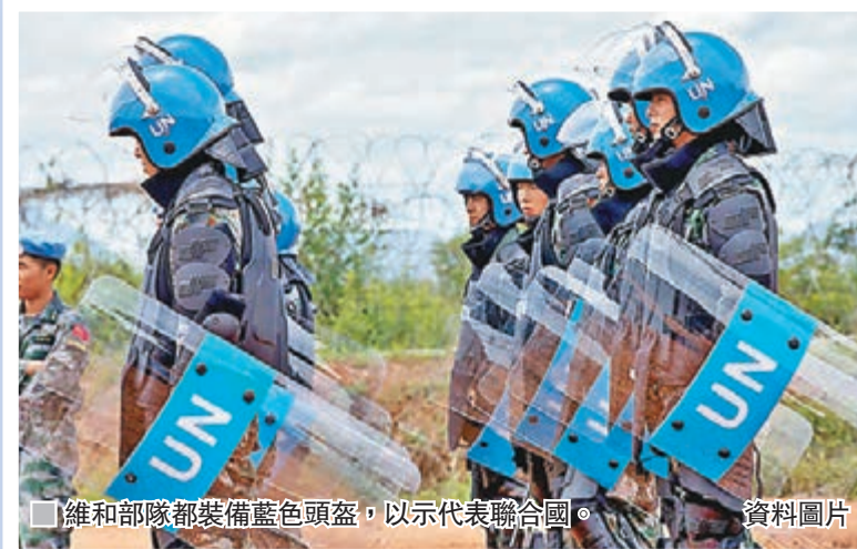
維和部隊都裝備藍色頭盔，以示代表聯合國。 資料圖片

聯合國的主要目標是維持和平，日常除了透過召開大會，進行溝通、化解大國之間的衝突和分歧以外，在某些衝突地區，聯合國亦會派維和部隊進駐，執行和平任務，例如監督停火協定等。除軍事衝突外，聯合國屬下亦設有多個組織，分別就人權問題、氣候變化、傳染病傳播、兒童生存與發展等問題專門研究和採取措施，解決人類社會的各種問題。