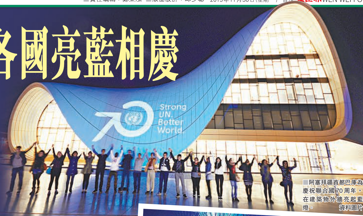
阿塞拜疆首都巴庫為慶祝聯合國70周年，在建築物外牆亮起藍燈。 資料圖片

2015年10月24日，是聯合國成立70周年的大日子，各地為慶祝聯合國「七十大壽」，紛紛在地標建築物亮起代表聯合國的藍燈以示慶祝。眾所周知，聯合國在國際扮演着重要角色。從調解國際衝突到文化保育等問題皆作出重大貢獻。然而，近年聯合國卻屢次被指無力解決國際爭端。在評選世界記憶遺產時甚至被其他國家威脅拒交會費，到底是什麼原因導致聯合國「綁手綁腳」，它的內部機制又有何局限？本文將會一一分析。 黃嘉康 兼任大學講師