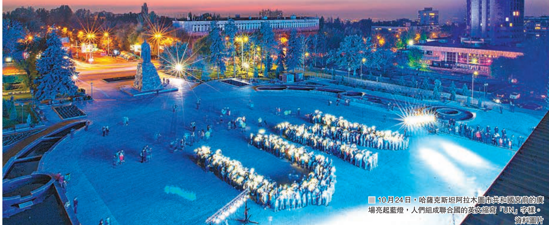
10月24日，哈薩克斯坦阿拉木圖市共和國富爾的廣場亮起藍燈，人們組成聯合國的英文縮寫「UN」字樣。 資料圖片

由此可見，聯合國經歷了70年的發展，它固然發揮了各國在國際事務上相互合作的積極角色。另一方面，國與國之間利用聯合國作為外交競爭平台而引發的衝突亦時有發生。但無論如何，在全球化過程中，隨着國際事務日益頻繁，聯合國這個「老店」仍會繼續在國際事務中扮演重要角色。