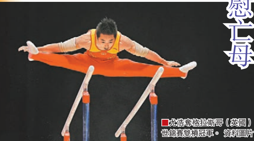
沈浩奪得格拉斯哥(英國)世錦賽雙槓冠軍。