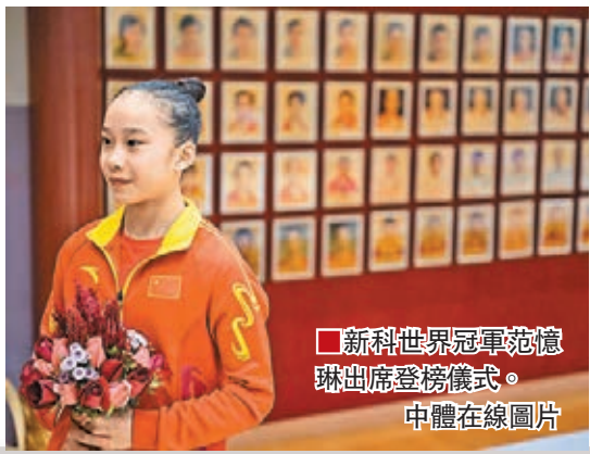
新科世界冠軍范憶琳出席登榜儀式。