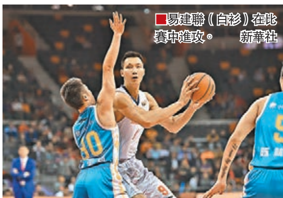
易建聯(白衫)在比賽中進攻。

香港文匯報訊(記者何花深圳報道)27日晚，CBA聯賽(中國男籃職業聯賽)結束常規賽第十輪較量，新疆、四川、廣東等豪強繼續高歌猛進，新疆隊更是獨孤求敗，此輪戰勝吉林隊後已是十連勝；而佛山、天津等弱旅繼續一敗塗地，其中天津九連敗，佛山隊更是一勝難求。