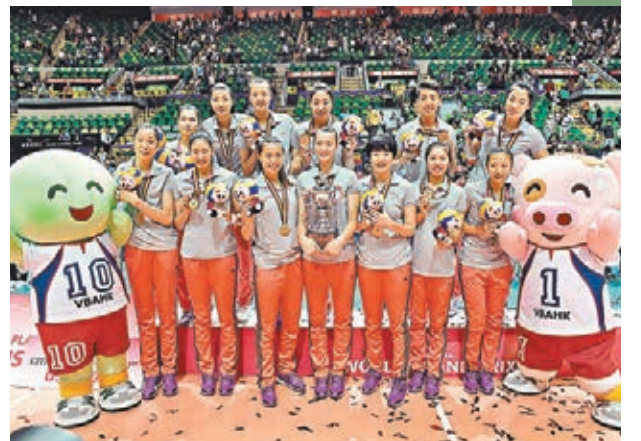
中國女排今年在港奪大獎賽分站冠軍。資料圖片

國際排聯日前公佈了2016年世界女排大獎賽賽程安排，2015世界女排大獎賽冠軍得主美國、十屆世界女排大獎賽冠軍得主巴西以及中國女排等12支隊伍被分至I檔，中國女排將參加中國寧波、中國香港以及中國澳門3站比賽，總決賽將於泰國曼谷舉行。