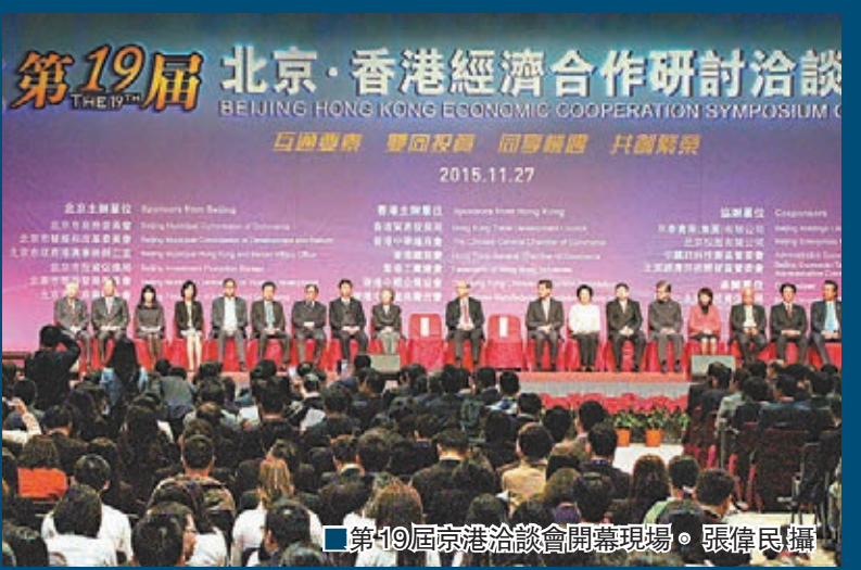
■第19屆京港洽談會開幕現場。

陳經緯表示，香港具有發達的物流體系，又擁有世界上眾多國際知名品牌，這一優勢與北京國際大都市和發達的開放型經濟體系強強聯合，將在跨境電商合作方面產生巨大的合作成果。當前國家高度重視跨境電子商務發展，今年6月國務院下發《國務院關於促進跨境電子商務健康快速發展的指導意見》，這有利於用「互聯網+外貿」擴大改革開放，並且有利於用「互聯網+一帶一路」推動國際上區域經濟合作。而香港作為「一帶一路」的樞紐，其現代服務業和金融業最具專業