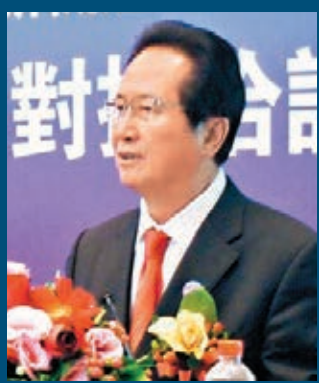
■全國政協經濟委員會副主任、全國工商聯副主席、香港中國商會主席、香港經緯集團主席陳經緯

香港文匯報訊 跨境電商們的「雙十一」狂歡尚未走遠，黑色星期五又再度掀起高潮。如何促進跨境電商的發展，成為在港召開京港洽談會上熱議的話題。早前全國政協經濟委員會副主任、全國工商聯副主席、香港中國商會主席、香港經緯集團主席陳經緯出席第19屆京港洽談會分場「跨境電商北京發展對接洽談會」時在會上表示，北京天竺綜合保稅區和北京平谷馬坊這兩個地方，可將境外採購變成境內採購，將「香港購」變為「境內的香港購」，還可以實現「買全球賣全球」。