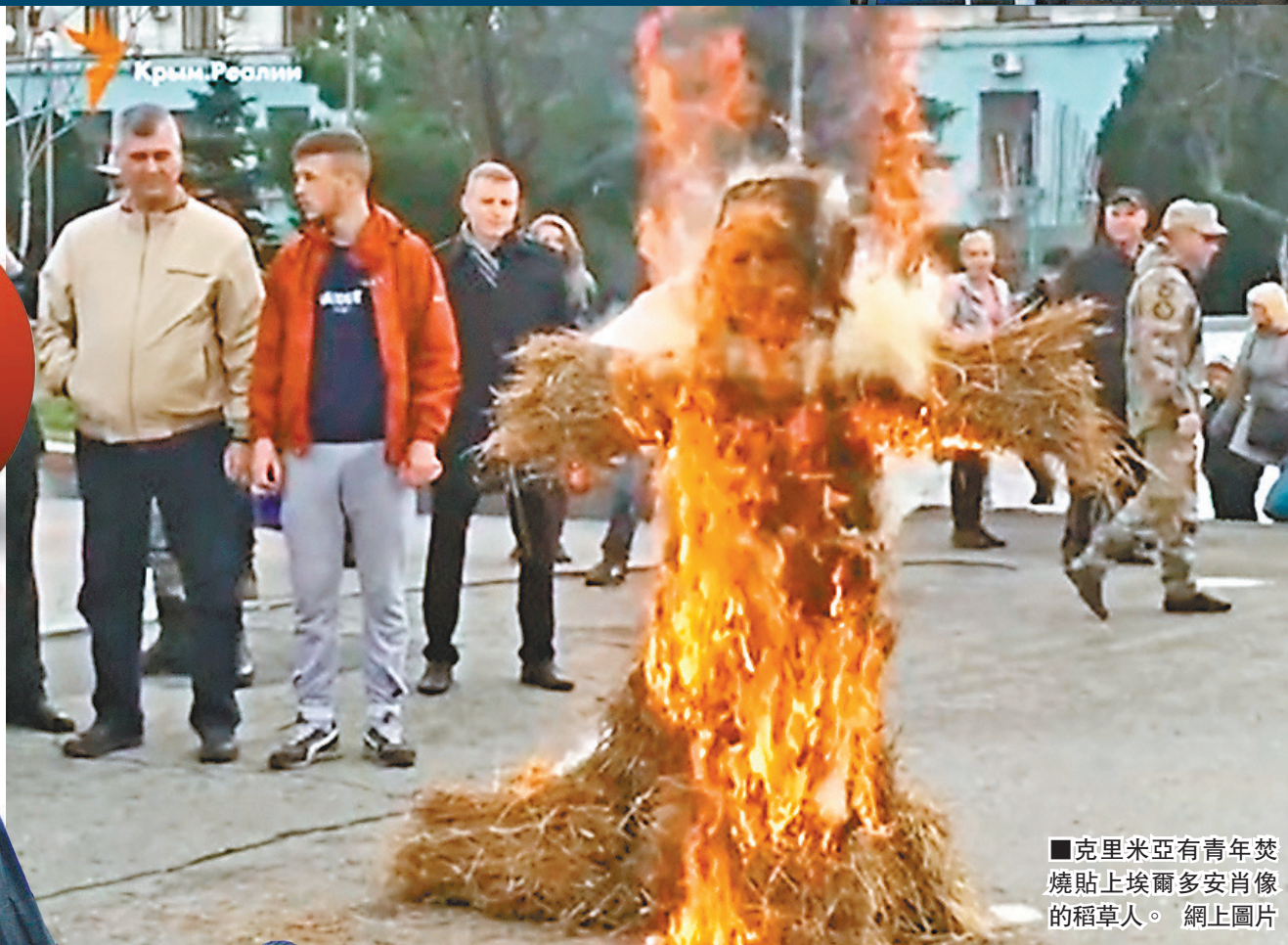
克里米亞有青年焚燒貼上埃爾多安肖像的稻草人。