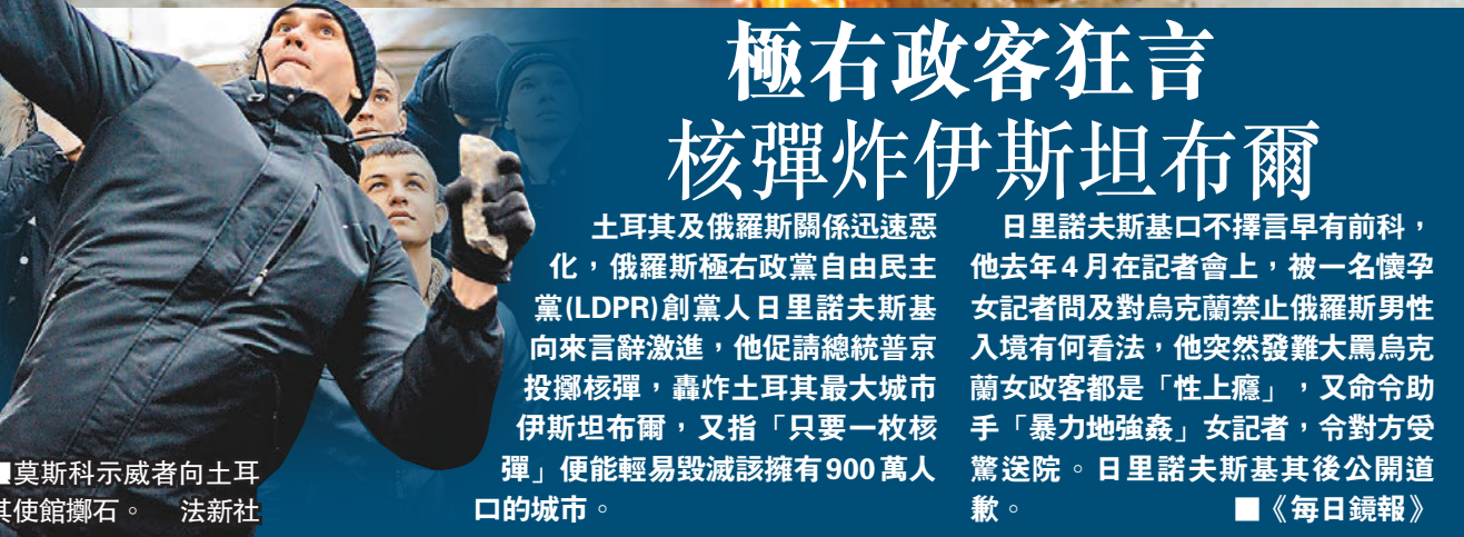
莫斯科示威者向土耳其使館擲石。

日里諾夫斯基口不擇言早有前科，他去年4月在記者會上，被一名懷孕女記者問及對烏克蘭禁止俄羅斯男性入境有何看法，他突然發難大罵烏克蘭女政客都是「性上癮」，又命令助手「暴力地強姦」女記者，令對方受驚送院。日里諾夫斯基其後公開道歉。 ■《每日鏡報》