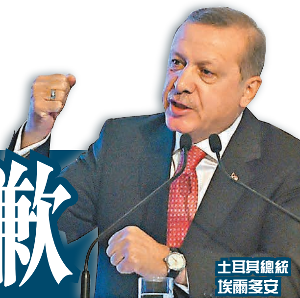
土日貝總統 埃爾多安

土耳其上週二擊落俄羅斯戰機，雖然兩國間的軍事緊張局勢已緩和，但雙方罵戰未止。土耳其總統埃爾多安前日提出與俄總統普京在巴黎氣候峰會上會談，但俄方很快便拒絕建議，克里姆林宮更透露，普京兩度拒絕接聽埃爾多安的來電，堅持除非土耳其道歉，否則不會與埃爾多安對話。在莫斯科及去年被併入俄羅斯的克里米亞，前日均有反土耳其遊行，示威者更焚燒印有埃爾多安肖像的稻草人洩憤。