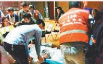
■傷者被抬走。 網上圖片

香港文匯報訊 據新華網報道，北京航空航天大學新聞中心28日晚對外公告稱，28日晚7時許，北航可靠性與系統工程學院在學校晨興音樂廳舉辦師生聯歡活動，謝幕環節，升降舞台發生意外沉降，致使部分師生跌落。截至目前，共有25人到醫院接受檢查。經醫院初步診斷，7人需繼續在醫院接受檢查，無重傷。有關事故原因正在進一步調查中。