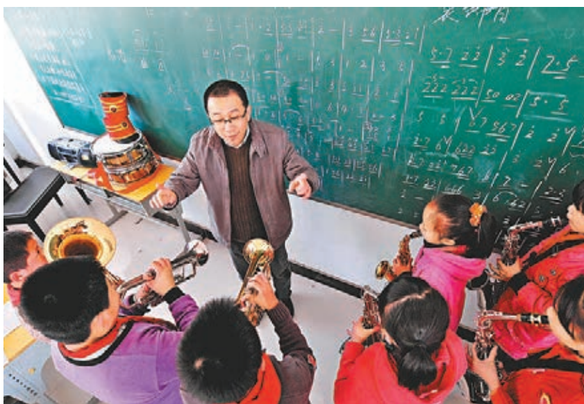
■國務院發文，要求慎重穩妥撤併鄉村學校，努力消除城鎮學校「大班額」。圖為福建閩侯縣白沙中心小學學生在老師的指導下學習樂器。

通知最後指出，要加大宣傳力度，營造良好氛圍。各地區、各有關部門要高度重視統一城鄉義務教育經費保障機制的宣傳工作，廣泛利用各種宣傳媒介，採取多種方式，向社會進行深入宣傳，使黨和政府的惠民政策家喻戶曉、深入人心，確保統一城鄉義務教育經費保障機制各項工作落實到