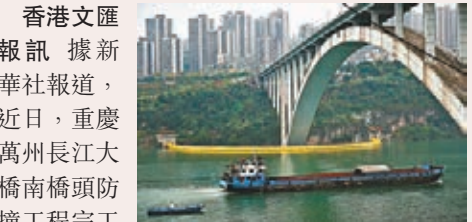
■昨日船舶從建有防撞裝置的萬州長江大橋下駛過。 新華社

香港文匯報訊 據新華社報道，近日，重慶萬州長江大橋南橋頭防撞工程完工並投入使用。據了解，依據三峽庫區水域特點和航運條件，並結合峽谷山區橋樑特徵，科研單位設計出「弧形水上升降式防撞裝置」。該防撞裝置引入船舶雙重保護的理念，通過設計，使船舶撞擊後避免發生翻船、沉船的事故。