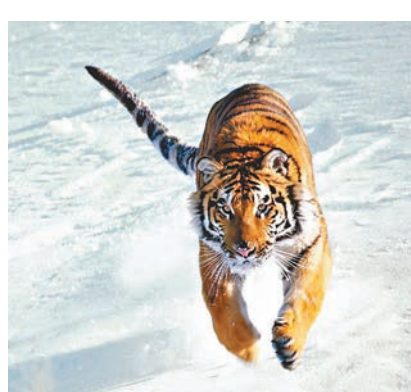
■此次在黑龍江發現野生東北虎，可以稱為真正意義的中國內陸虎。圖為在吉林長白山地區拍攝到的野生東北虎。

此次野生東北虎的發現和定居，不僅是中國內陸地區野生東北虎恢復的重要標誌，而且對張廣才嶺的北部棲息地的恢復，以及連接北部完達山種群都具有重要作用。