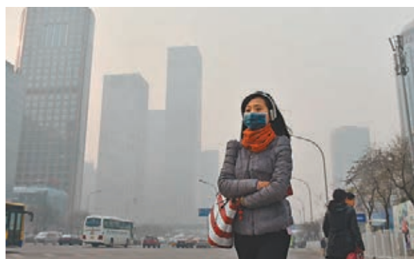
■河南中北部與京津冀中南部空氣再陷重污染。圖為昨日一名戴口罩的行人在霧霾下的北京街頭行走。

環保部環境監察局27日消息稱，已經派出4個督查組，分赴北京、天津、石家莊、廊坊等城市採取暗查、暗訪等方式重點督查重污染天氣應急應對工作開展情況。