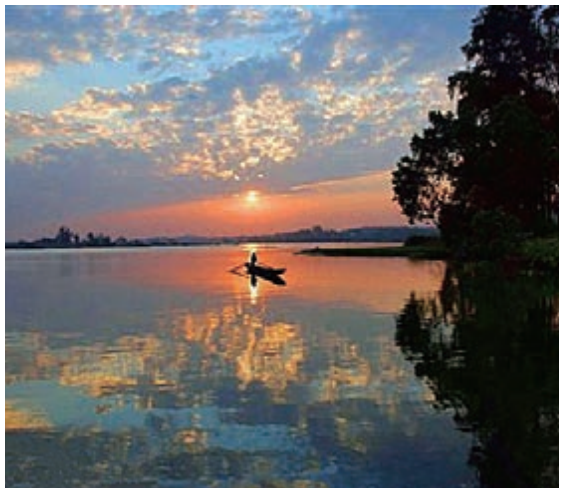
■兩廣同飲一江水，上下游的生態環境關係着兩地的協調發展。從去年7月開始，兩廣開始攜手共同治理九洲江流域污染。

此外，作為最具增長動力的綠色產業，粵桂兩省借高鐵開通的契機，開始謀劃推動健康生態旅遊業的合作。10月20日，2015年兩廣十市區域旅遊合作聯席會議在廣東雲浮市召開。會上，兩省區簽署《兩廣十市共同促進和打造健康養生旅遊產業(雲浮)宣言》，將健康養生游作為兩省未來合作發展旅遊產業的新方向。廣西壯族自治區旅遊發展委員會相關負責人表示，粵桂兩省區旅遊資源都十分豐富，產品的差異性大，旅遊市場具有很強的互補性，旅遊產業具有共同發展的廣闊前景。