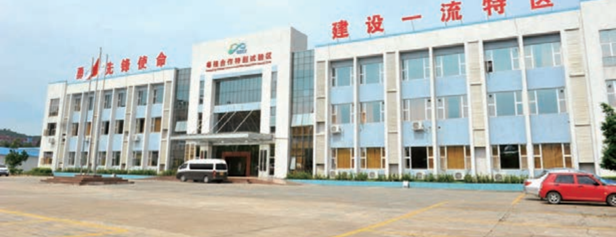
■粵桂合作特別試驗區是兩廣探索區域一體化協調發展的新路徑。圖為坐落廣西梧州的粵桂合作特別試驗區辦公大樓。

兩廣為加強港口合作，推動環北部灣地區經濟一體化發展，6月粵桂瓊三地海關實行「三地七方聯動」。據初步估算，三地七方聯動後，一艘可裝載300個20尺集裝箱的進出口船舶，航行「香港—湛江—海口—北部灣港—香港」航線，一次掛港可實現有裝有卸，每航次可節省航運時間約30小時，縮短船線距離約100海里，整船出口集裝箱可節約運輸成本近10萬元。