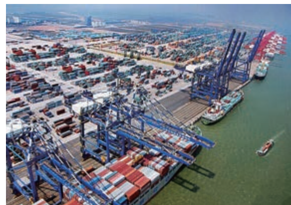
■11月16日，廣州港—梧州港聯運「穿梭巴士」首航，這是粵桂兩地之間首度開通水上「穿梭巴士」。圖為繁忙的廣州港碼頭一覽。

近年來，廣西梧州承接廣東兄弟城市的產業轉移，再生資源、再生不銹鋼製品、陶瓷建材等重點產業園區均由佛山企業整體轉移而來。而隨着南寧至昆明客運專線南寧至百色段正式進入試運行階段，今後，廣州至百色全程將只需5小時左右，這為兩廣深入開展高鐵沿線旅遊合作帶來新的契機。