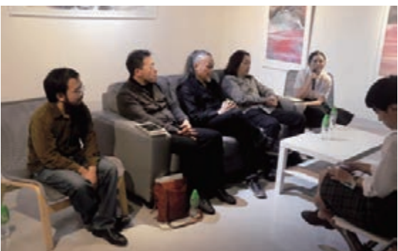
■展覽開幕式前的學術沙龍。

於不同的時代，基於自身生命經驗，各自探索繪畫的素材、方法、構圖、主題，並為水墨畫注入新力量，發掘內心自由、民間興趣和時代精神。展覽透過展示水墨畫作，在當代語境下為「文人畫」與「人文畫」辯白，探索其表面差異之中的複雜性及隱含的關聯。舉辦本次展覽的香港灣仔畫廊位於香港灣仔港灣道1號會展廣場閣樓(ArtOne藝術畫廊中心)13號，展覽將持續至2016年1月5日，期間歡迎社會各界人士前來參觀。