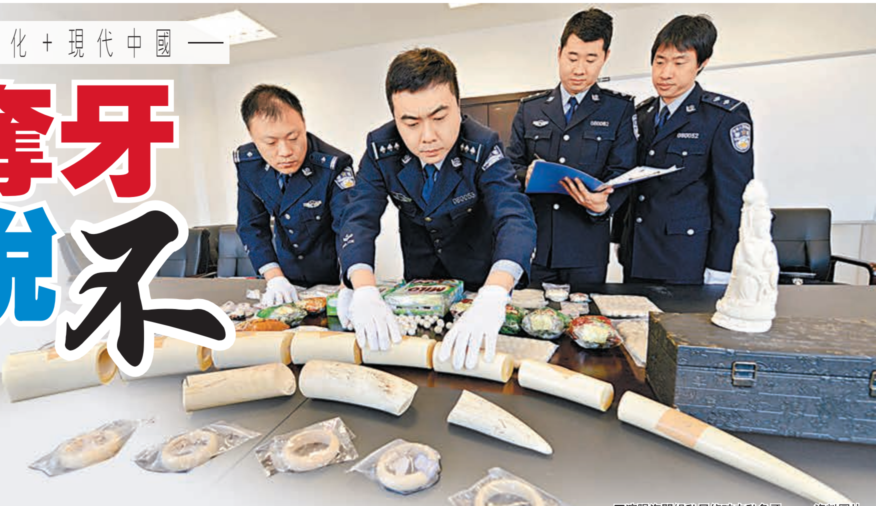
■瀋陽海關緝私局偵破走私象牙。