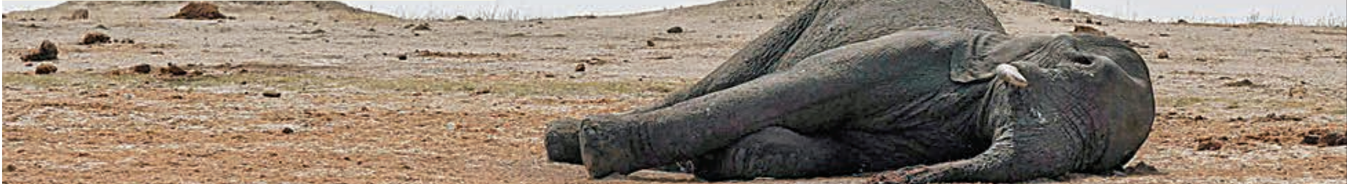
■津巴布韋的大象被獵人以氰化物溶入食水中毒害，以取得牠的象牙。

中美早前承諾全面禁止象牙進出口，香港也會跟從，但需先了解有關協議內容，看看如何配合。