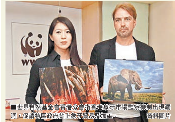
■世界自然基金會香港分會指香港象牙市場監察機制出現漏洞，促請特區政府禁止象牙貿易及加工。