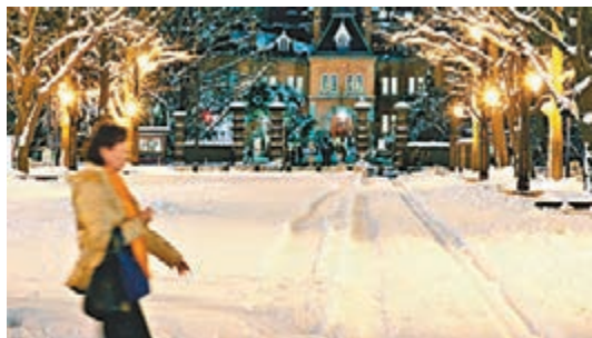
■北海道札幌的地上昨日佈滿積雪。