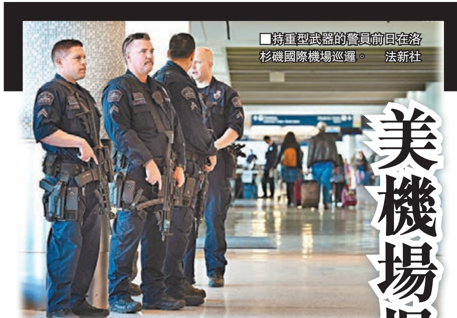
■持重型武器的警員前日在洛杉磯國際機場巡邏。