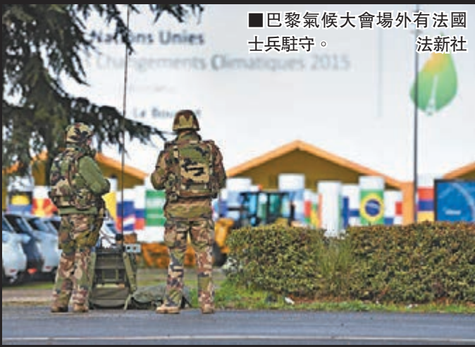
■巴黎氣候大會場外有法國士兵駐守。