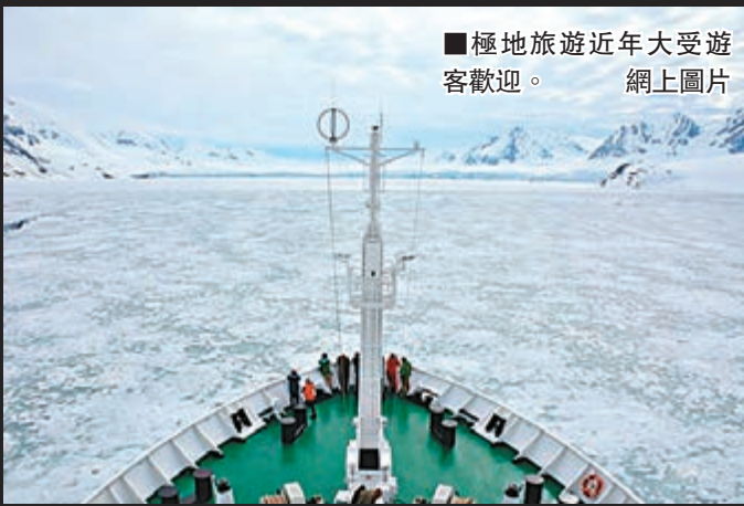
■極地旅遊近年大受遊客歡迎。