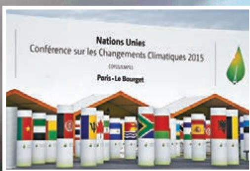
巴黎氣候大會會場

聯合國氣候變化秘書處前日宣佈，各國資深官員將提前在周日於巴黎會議廳開會，把握時間談判，為翌日的領導人峰會作準備。外界關注峰會能否達成減排協議，減少依賴化石燃料。