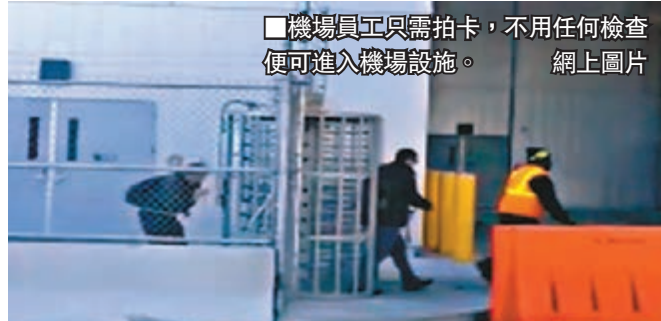
■機場員工只需拍卡，不用任何檢查便可進入機場設施。網上圖片