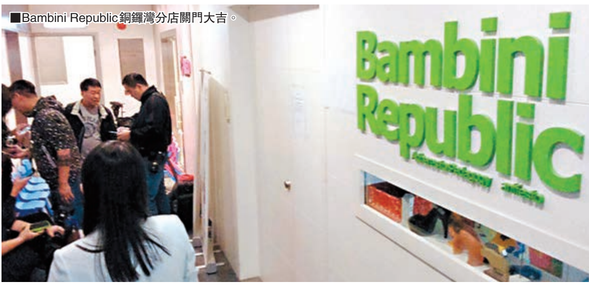
■Bambini Republic銅鑼灣分店關門大吉。

香港文匯報訊（記者 姜嘉軒）學前幼兒英語教育中心 Bambini Republic 港九4間分店近日突然全線結業，大批已預繳學費的家長損失慘重，金額由數千元至數萬元不等；另有部分家長懷疑被游說入股投資，金額更達數十萬元至100萬元不等，有關家長至近日始發現從未入股，懷疑受騙因此報警求助。警方及海關等執法部門分別接獲多宗報案，正調查事件是否涉及刑事罪行。教育局及社會福利署回覆指，教育中心提供的非正式教育課程不納入規管範圍，家長選擇報讀時必須小心。