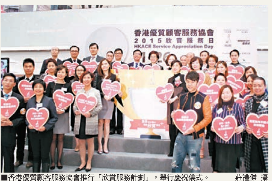
■香港優質顧客服務協會推行「欣賞服務計劃」，舉行慶祝儀式。

她表示，龍耳中心推出的「聽障家庭兒童發展計劃」，透過免費言語治療服務、資助補習、課外及家庭聯誼活動，幫助聽障家長及其子女，為期兩年的計劃首期已在今年9月開展，目前已有約100個家庭參與。計劃提供免費言語治療服務，由社工、言語治療師及兒童發展顧問負責，透過發音、話語理解及表達、社交溝通技巧等訓練，協助來自聽障家庭的兒童提升溝通能力。