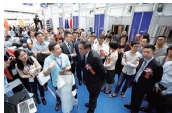
廣州國際輕紡展貿服務管理平台不斷創新，最新上線的全球面輔料電商平台獲得業界好評。