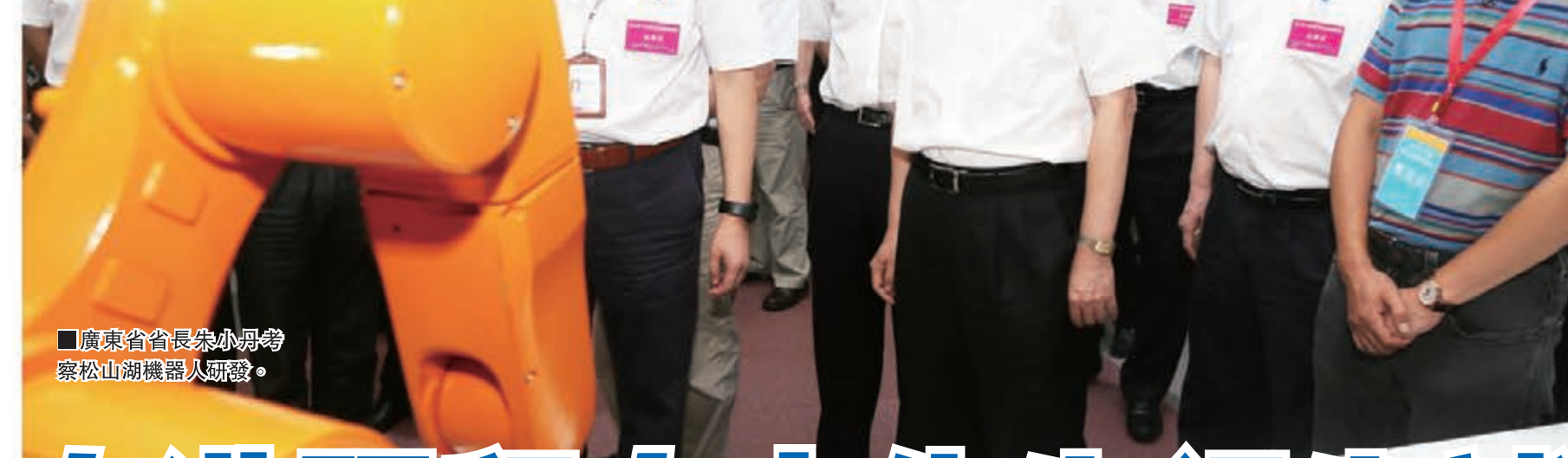
廣東省省長朱小丹考察松山湖機器人研發。

《廣東協議》實施以來，港澳對廣東服務業投資增速喜人。 1、2015年1-8月，港澳對廣東的投資項目3055個、合同外資273.3億美元、實際外資145.11億美元，同比分別增長5.71%、31.08%和23.41%；分別佔全省同期總額的75.17%、85.43%和80.06%。 2、港澳投資服務業項目2464個、合同外資205.46億美元、實際外資97.6億美元，同比分別增長13.71%，67.11%和53.87%；分別佔全省同期服務業外資總額的75.14%、87.89%和89.27%。 3、備案辦法實施以來，截止到9月底，廣東完成備案項目（企業）147宗，新設項目77個、變更項止70個。其中，新設項目合計吸收合同外資44.47億元人民幣，主要分佈在商務服務業、批發業及軟件和信息技術服務業等領域。