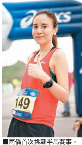
■雨僑首次挑戰半馬賽事。

又累到幾乎斷，但她咬著牙關堅持，早前她參加香港十公里挑戰賽，以1小時20分鐘跑完全程成功過關。