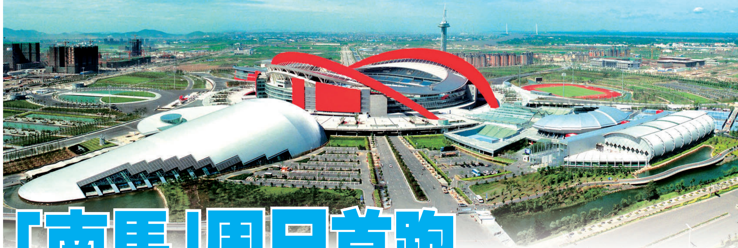
■「南京」全程起終點都設在地標性建築奧體中心。