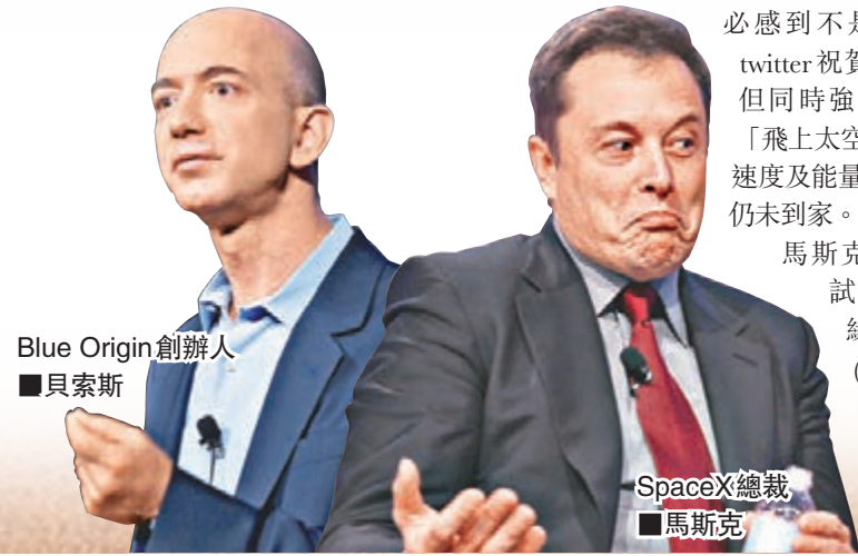
Blue Origin 創辦人 貝索斯