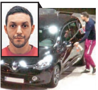
被通緝的阿布里尼

30 歲的阿布里尼被發現在巴黎恐襲前兩日，於法國東北部城鎮雷松的一個加油站，與薩拉赫坐在涉案汽車內。比利時警告，阿布里尼「危險且可能