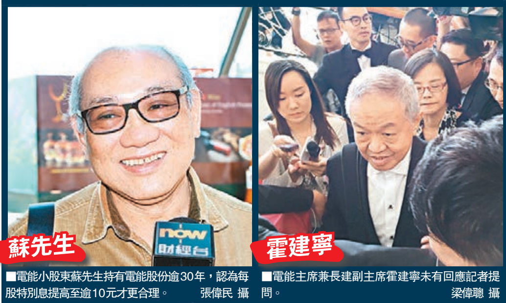
■電能小股東蘇先生持有電能股份逾30年，認為每股特別息提高至逾10元才更合理。 ■電能主席兼長建副主席霍建寧未有回應記者提問。