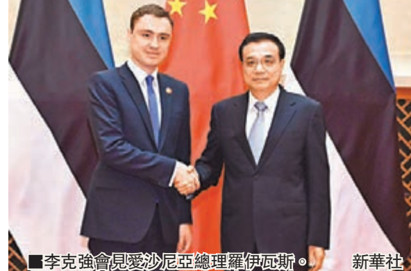
李克強會見愛沙尼亞總理羅伊瓦斯。

香港文匯報訊 據中通社報道，國務院總理李克強24日上午在蘇州分別會見出席第四次中國—中東歐國家領導人會晤的愛沙尼亞總理羅伊瓦斯、波蘭總統杜達和斯洛文尼亞總理采拉爾。另據新華網報道，結束與羅伊瓦斯會談後，李克強當即對國家發改委主任徐紹史表示，要迅速與泛波羅的海鐵路聯盟對接，加快推進波羅的海鐵路項目建設。