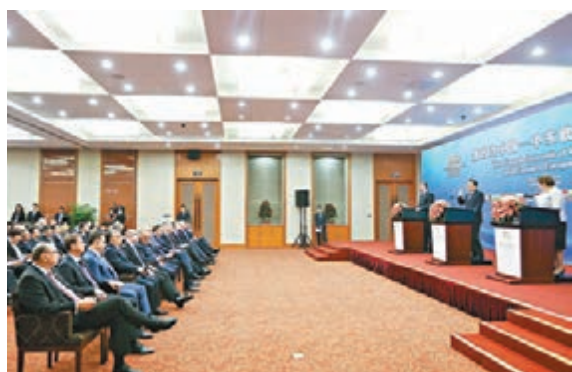
中東歐14國領導人在台下就坐。