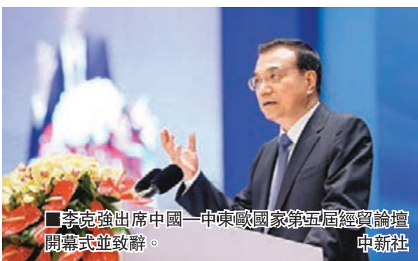
李克強出席中國—中東歐國家第五屆經貿論壇開幕式並致辭。