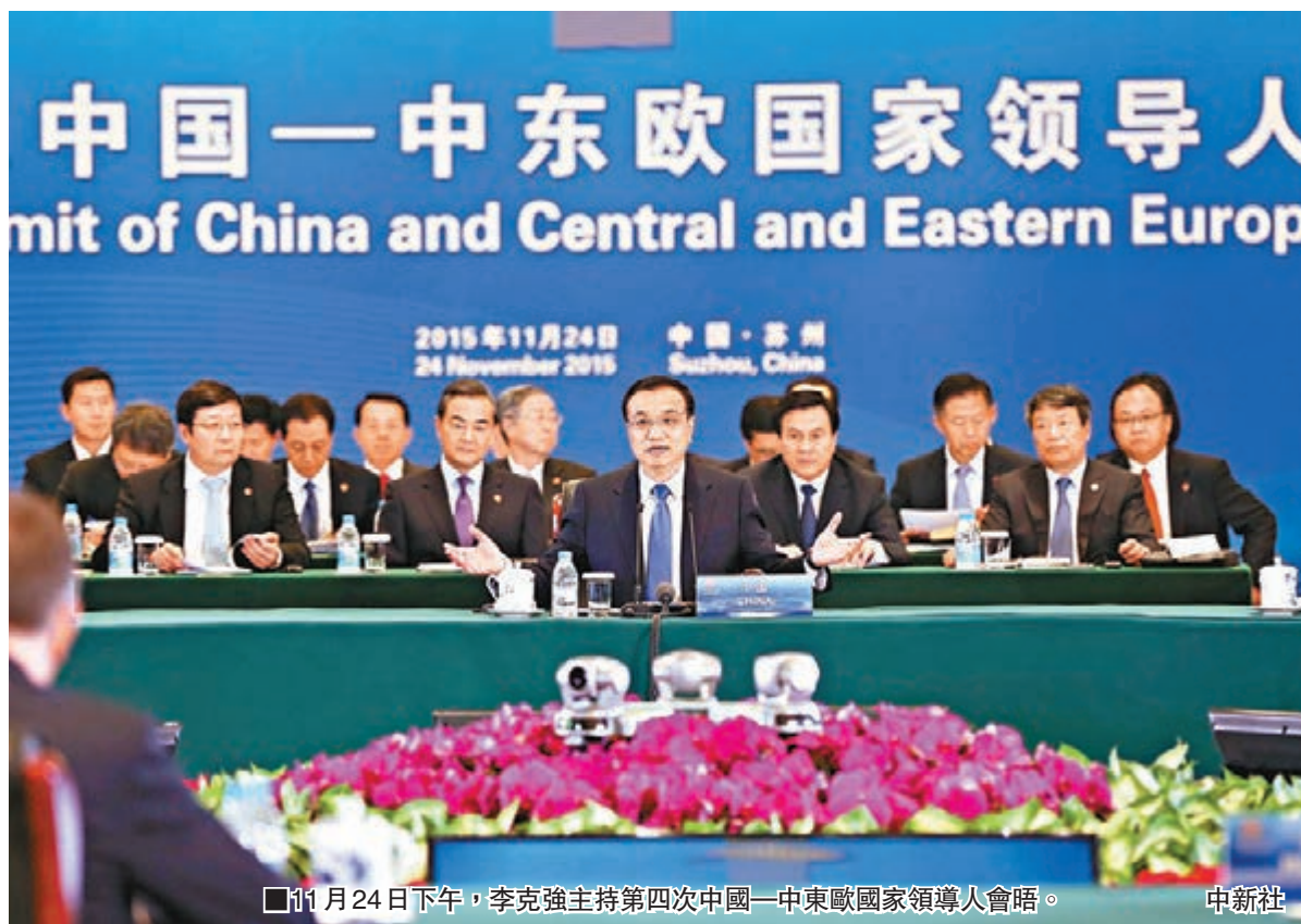
11月24日下午，李克強主持第四次中國—中東歐國家領導人會晤。