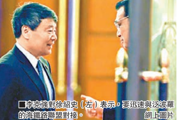
李克強對徐紹史（左）表示，要迅速與泛波羅的海鐵路聯盟對接。

羅伊瓦斯表示，愛方歡迎中國投資，願發揮地理優勢，成為中歐互聯互通的重要樞紐，並加強雙方在信息技術、農牧業、旅遊等領域合作。