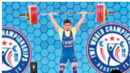
吳景彪在比賽中。

強陣出擊2015侯斯敦世界舉重錦標賽的中國隊在首個金牌日表現不俗，第一次出征世錦賽的17歲小將蔣惠花不負眾望摘得女子48公斤級抓舉和總成績金牌；奧運亞軍吳景彪打破男子56公斤級抓舉世界紀錄，但在總成績上不敵刷新挺舉世界紀錄的朝鮮選手嚴潤哲，位居次席。