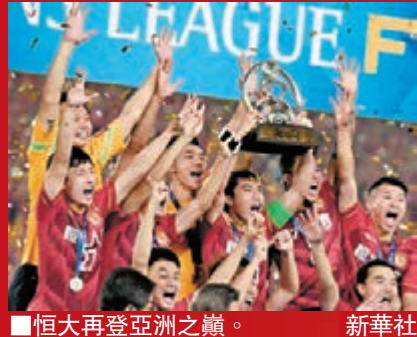
恒大再登亞洲之巔。

前晚，恒大再一次站上亞洲之巔，自2010年衝超成功後，五年內豪取10個冠軍頭銜。橫向相比，恒大無疑是十年來亞洲最成功的足球會，恒大能夠雄霸亞洲，職業化管理、高投入，無疑是最大的推動力。