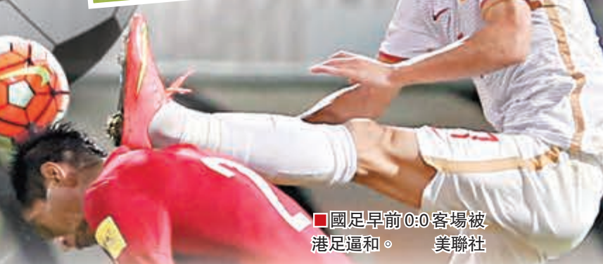
國足早前0:0客場被港足逼和。