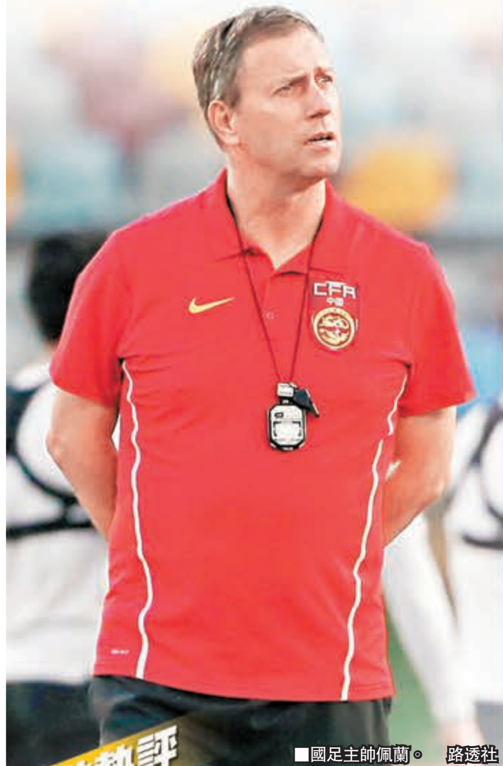
國足主帥佩蘭。

幾乎在廣州恒大二度奪得亞冠冠軍的同時，近期處於輿論風口浪尖的中國足協前晚在其官網發表聲明，對國足在世界盃外圍賽(世外賽)上的表現向球迷道歉，並稱近期將嚴格評估國足主帥佩蘭。