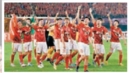
恒大胸前球衣廣告涉嫌違約。

三年第二次站在亞洲之巔的恒大惹來了麻煩——前晚，在他們在天捧起亞冠獎盃的同時，東風日產公司一則官方微博在網上被瘋狂轉發，直指恒大單方面用「恒大人壽」替換「東風日產」的胸前球衣廣告，涉嫌違約。