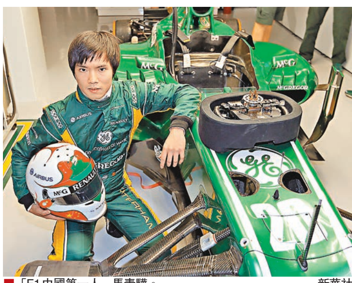
■「F1中國第一人」馬青驊。

身披「中國F1歷史創造者」的光環,上海籍車手馬青驊2012年以HRT車隊試車手的身份在意大利蒙扎賽道完成個人的F1首秀,創造歷史。2012年11月HRT車隊還宣佈他將以正選車手身份出戰次年4月的F1上海站,無奈該車隊於當年年底解散,後馬青驊轉投卡特漢姆車隊,以試車手身份亮相上海