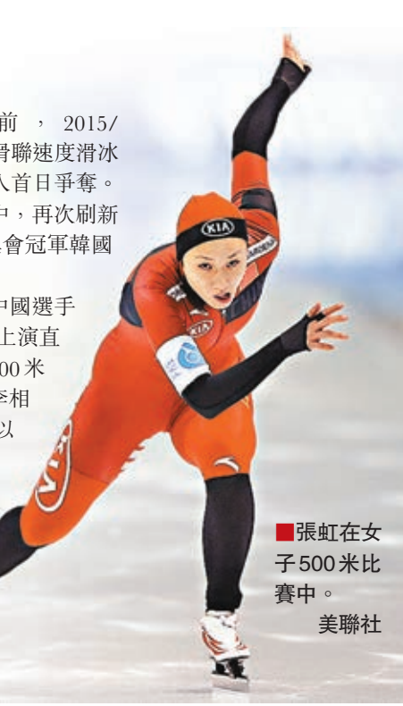
■張虹在女子500米比賽中。 美聯社

獲得冠軍後,張虹發微博稱:「遇到你(李相花),我已經不再膽怯了,信心是一點一滴積累的,繼續努力。」 香港文匯報記者 梁啟剛