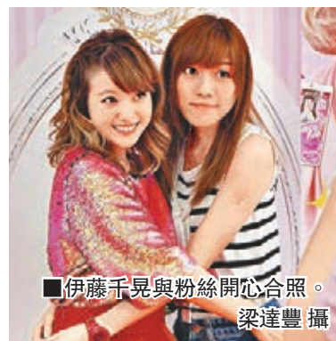
■伊藤千晃與粉絲開心合照。

千晃昨天在下午兩時率先現身第一場活動，現場有數十粉絲前來捧場，有粉絲帶來簽名橫幅及花支持她。千晃昨日神采飛揚，甫現身即友善揮手及以廣東話說「大家好」。粉絲看見偶像表現興奮，有人用日文大讚她可愛，千晃亦讚香港粉絲既溫柔又熱情，希望跟各位做朋友。在今年與隊友在九展開騷的她還表示希望明年再來港開演唱會。