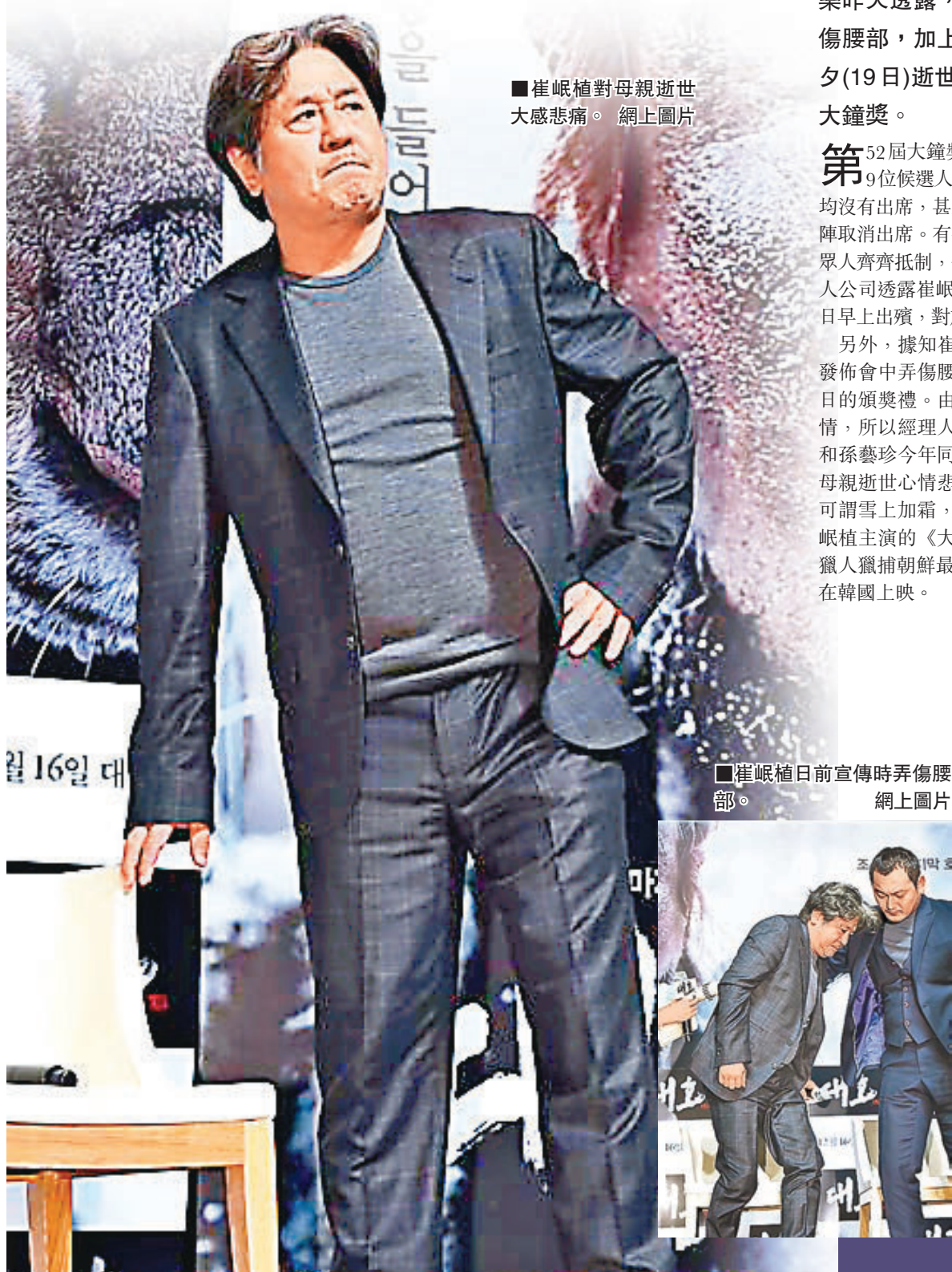
■崔岷植對母親逝世大感悲痛。

韓國演技派男星崔岷植，今年被委任為前日舉行的第52屆大鐘獎電影節頒獎禮的宣傳大使，可是他竟然與一眾影帝影后候選人一樣齊缺席頒獎禮。崔岷植的經理人公司C-Jes娛樂昨天透露，崔岷植於日前宣傳新片時不慎弄傷腰部，加上崔岷植的母親在大鐘獎頒獎禮前夕(19日)逝世，在身心俱疲下，決定缺席今次大鐘獎。