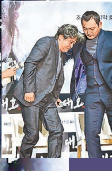
■崔岷植日前宣傳時弄傷腰部。網上圖片