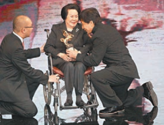
資深藝人李麗華(中)獲頒終身成就獎,由成龍(右)頒獎。