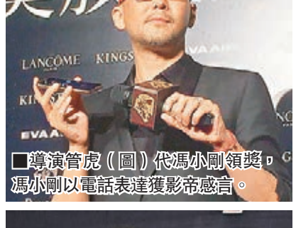
導演管虎(圖)代馮小剛領獎,馮小剛以電話表達獲帝帝感言。