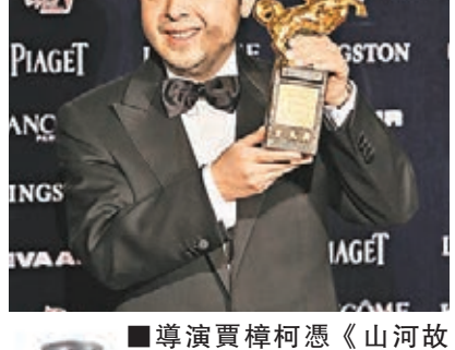
導演賈樟柯憑《山河故人》獲最佳原著劇本獎。