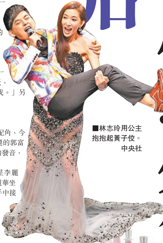
林志玲用公主抱起黃子佼。