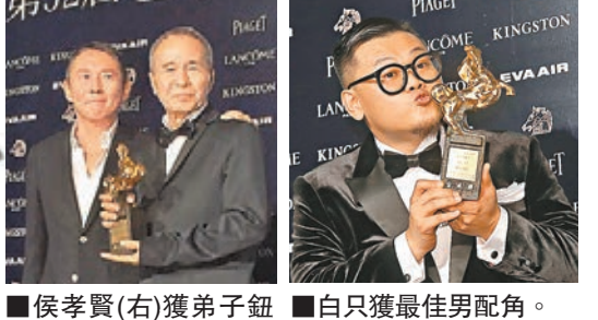
侯孝賢(右)獲弟子鈕 白只獲最佳男配角。承澤遞交獎座。

《麥兜·我和我媽媽》奪得金馬獎最佳動畫長片,電影的出品人、香港新華集團主席蔡冠深博士強調,《麥兜》的得獎來之不易,這是香港創新產業的驕傲,也是香港電影人和動漫人堅持不懈、努力耕耘的成果!他強調,新華集團從2006年至今,一直支持麥兜,是因為這隻小豬身上,體現出香港自強不息、笑對逆境的精神!今後,新華集團一定會繼續支持麥兜的製作和發行,他並對兩岸三地所有喜愛麥兜的影迷表示衷心的感謝!