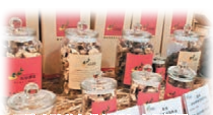
陳皮隨着年份的增加身價暴漲,頗具收藏價值。

第三屆新會陳皮文化節近日開幕,國家質檢總局正式授牌予廣東新會區「國家地理標誌產品保護示範區」,中國藥文化研究會授予新會「中國藥文化產業示範基地」,中國茶葉流通協會則授予新會「中國陳皮茶之鄉」的美譽。早在宋代,新會陳皮就已成爲南北貿易的「廣貨」之一,行銷全國和南洋等地區。預計今年底,新會柑種植面積約6萬畝,掛果面積超3萬畝,果品產量達6萬噸,同比增長30%;年加工陳皮量