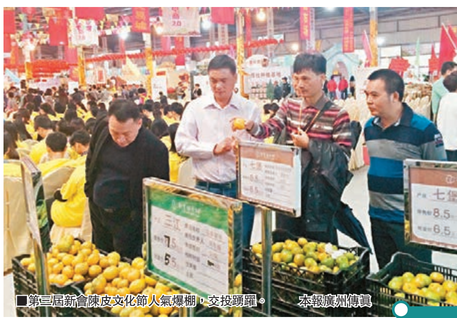
第三屆新會陳皮文化節人氣爆棚,交投踴躍。

早在2006年,新會柑、新會陳皮雙雙獲批國家地理標誌保護產品;2008年,新會陳皮獲批國家地理標誌證明商標;2009年,新會陳皮入選廣東非物質文化遺產名錄。第三屆新會陳皮文化節圍繞「文化·產業·健康·互聯網+」主題,弘揚陳皮「和藥」、「陳藏」、「養生」、「茶道」四大文化精粹;探討陳皮產業的發展趨勢,啟動新會陳皮科研項目專家庫。與會專家表示,陳皮產業要積極擁抱互聯網,要普及電商經濟模式,讓新會陳皮在「互聯網+農業」的框架內成為國家級健康養生產業。