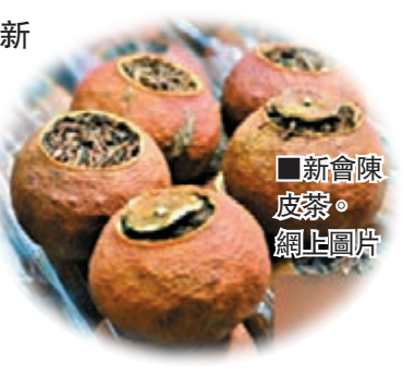
新會陳皮。網上圖片

香港文匯報訊(記者 于濱 江門報導)新會陳皮是中國傳統地道藥材,由於品種、水土、氣候、工藝等特殊成因,具有明顯而嚴格的地域性,素有「百年陳皮勝黃金」之美譽。新會最近把目光投向互聯網,與京東集團簽訂農村電商戰略合作協議,打造首個農村電商2.0示範點,謀求百年陳皮傳統產業的華麗轉型。