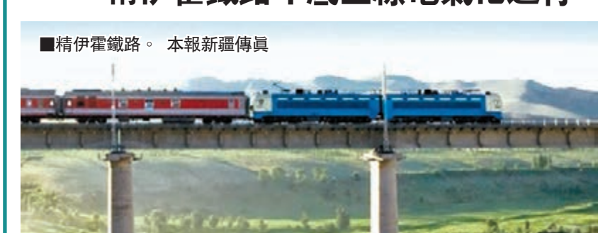
精伊霍鐵路。本報新疆傳真

香港文匯報訊(記者 馬晶晶 新疆報導)伊(寧)霍(爾果斯)電氣化鐵路牽引站110千伏外部供電工程預計今年底投入使用,屆時,新疆第一條電氣化鐵路——精(河)伊霍鐵路將實現全線電氣化運行。精伊霍鐵路伊寧至霍爾果斯段電氣化改造工程線路全長約71公里,去年6月1日開工建設。目前,伊霍間列車採用的是內燃機車運行,電氣化改造完成後,伊寧至霍爾果斯間鐵路的牽引質量會由目前內燃機車的2,000多噸,提升到4,000多噸,並且電力機車使用電能作爲動力,要比內燃機車的柴油更節能、環保、經濟。據了解,精河至伊寧於2009年12月就開通了電氣化鐵路,中國鐵路總公司去年投資兩億元,開始對伊寧至霍爾果斯間鐵路進行電氣化改造。