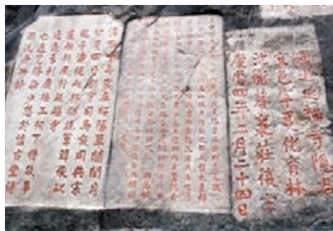
九日山摩崖石刻是海上絲綢之路發展的歷史見證。

香港文匯報訊(記者 黃瑤瑛 泉州報導)記者昨日從福建省泉州有關部門獲悉,《泉州海上絲綢之路史蹟保護條例》將成為泉州首部實體法。通過首部實體法保護,將有利於海絲文化的進一步發掘和傳承,推進海絲申遺。