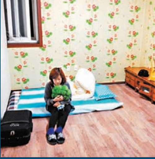
▲Cherry在仁川居住，租金不貴。