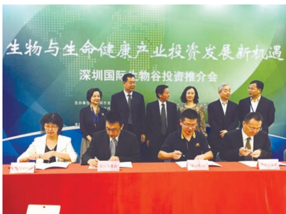
■深圳市大鵬新區在第十七屆高交會上舉行了國際生物谷推介會，並在國際生物谷推介會上進行項目簽約。