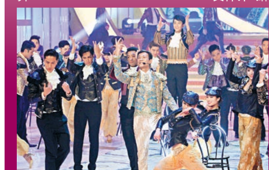
■鄭少秋帶領眾男藝員勁歌熱舞。

由岑麗香、黃心穎、陳凱琳、蔡思貝等多位花旦表演的《大姐花旦歌舞團》，眾女均以白色低胸短裙性感上陣，其中以黃心穎的身材最有睇頭，而三位大姐羅蘭、朱咪咪以及麥玲玲，三人戴上紅色假髮，以PINK LADY造型壓軸出場表演，之後玩遊戲《台慶超強選擇一分鐘》，要觀眾竞猜三位大姐的腰圍，由細至大排列，結果麥玲玲的廿七吋腰排首位，僅次於玲玲的是三十吋腰的羅蘭姐，而最尾的是朱咪咪卻不肯透露腰圍吋數，只說是三十幾吋。