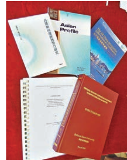
■部分涉事教員的博士論文曾在國際學術會議發佈,或收錄在學術期刊,有一定學術質素。