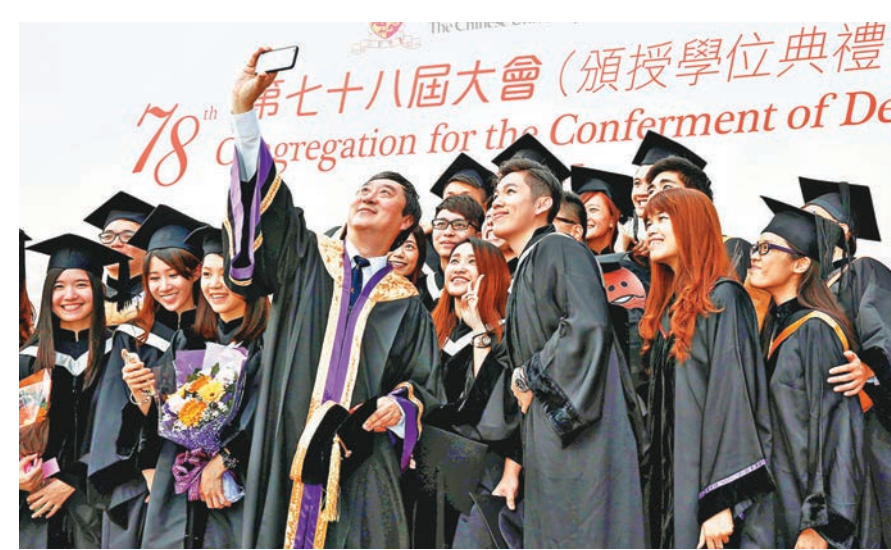
■中文大學昨舉行學位頒授典禮,校長沈祖堯與畢業生開心合照。

香港文匯報訊(記者 周子優)中文大學昨天舉行第七十八屆頒授學位典禮,由校長沈祖堯主禮,向該校2015年度碩士及學士畢業生頒授學位。大會並同時舉行「卓敏教授席」就職典禮,向27名優秀的教研人員頒發傑出教學及研究獎,嘉許他們的卓越成就。