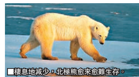
棲息地減少，北極熊愈來愈難生存。