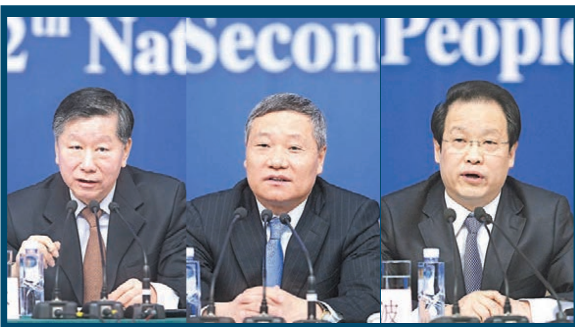
■中銀監主席尚福林。資料圖片 ■中證監主席肖鋼。資料圖片 ■中保監主席項俊波。資料圖片