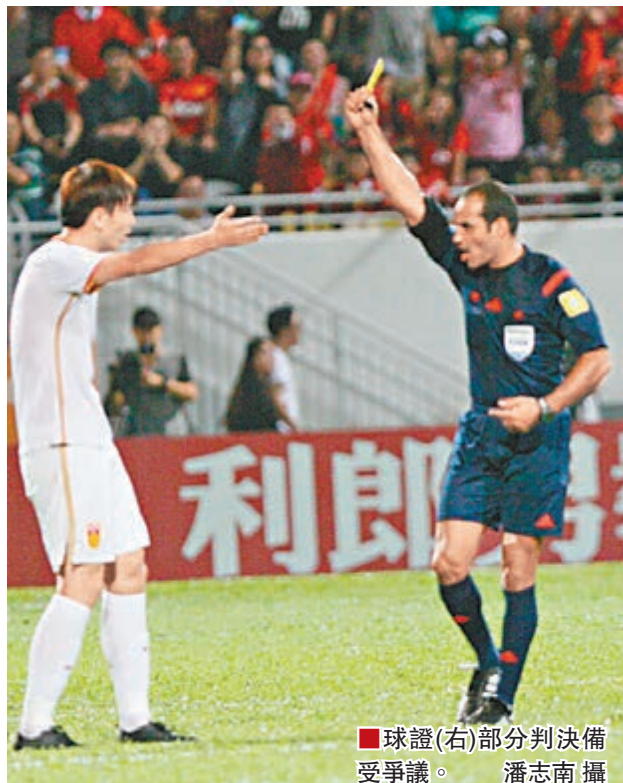
球證(右)部分判決備受爭議。