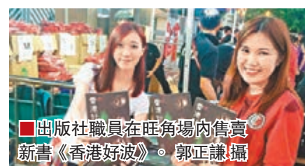
出版社職員在旺角場內售賣新書《香港好波》。

港足在世界盃亞洲區外圍賽有好表現，掀起一片港足熱潮，有出版社早前便與香港足總合作，獲授權出版新書《香港好波》，並在昨日於旺角場內首