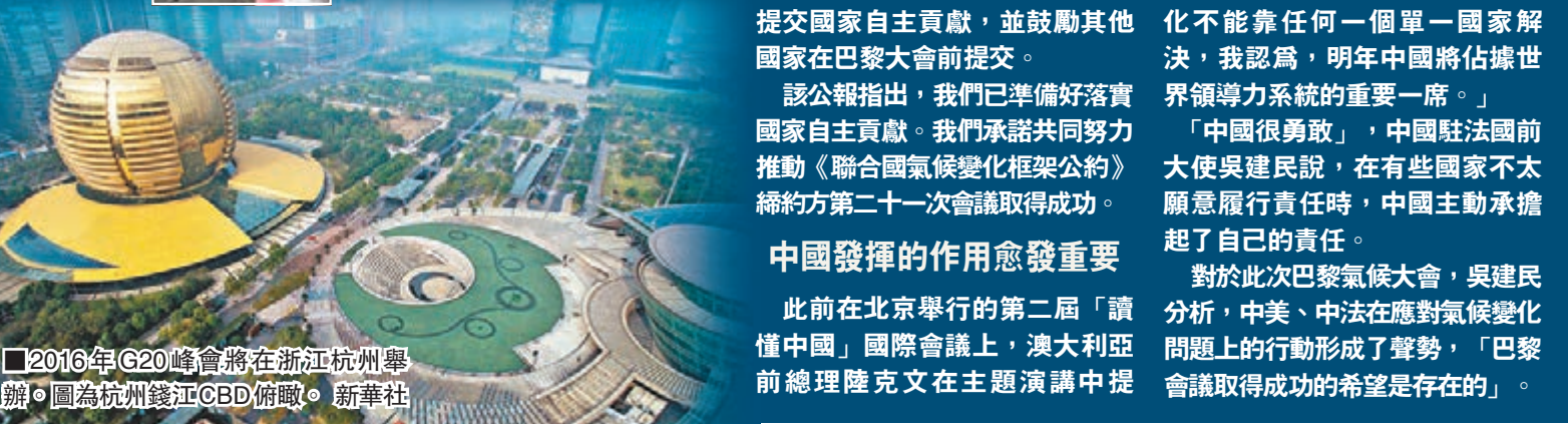
2016年G20峰會將在浙江杭州舉辦。圖為杭州錢江CBD俯瞰。

對於此次巴黎氣候大會，吳建民分析，中美、中法在應對氣候變化問題上的行動形成了聲勢，「巴黎會議取得成功的希望是存在的」。