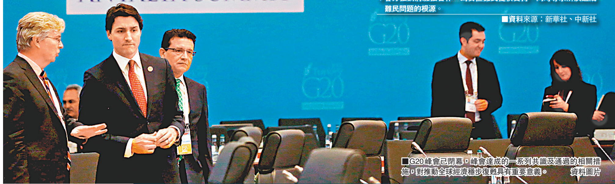
G20峰會已閉幕，峰會達成的一系列共識及通過的相關措施，對推動全球經濟穩步復甦具有重要意義。資料圖片