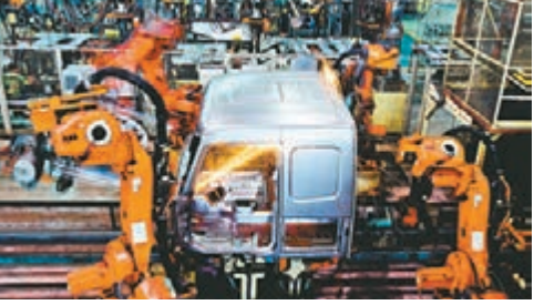
外媒稱G20峰會中國向世界傳遞了信心。圖為機器人正在焊接作業。

香港文匯報訊 據中新社報道，在土耳其南部城市安塔利亞召開的二十國集團領導人(G20)會議當地時間16日落下帷幕，外媒對此紛紛給予關注，熱議中國國家主席習近平把脈世界經濟，傳遞中國信心。