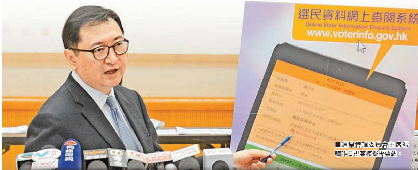
選舉管理委員會主席馮驊昨日視察模擬投票站。