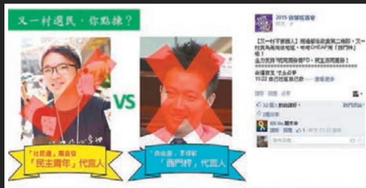
近日在網上大捧反對派候選人並侮辱建制派候選人的專頁,擺明就是選舉廣告。